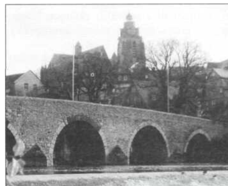
Historický most a katedrála ve Wetzlaru