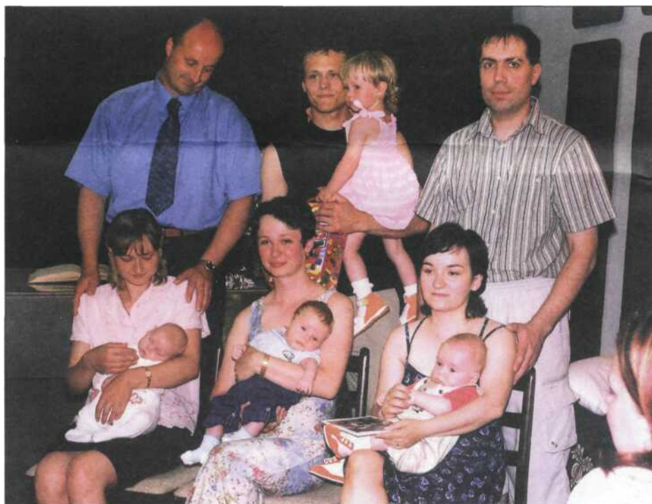
Vítání občánků dne 29. 5. 2005 v Třebčíně.

Narozeným dětem přejeme, aby jejich příští dny a cesty byly plné slunce a pohody.