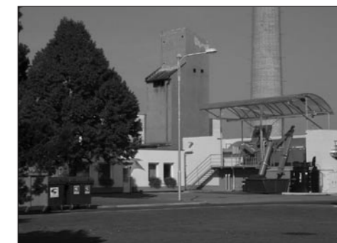
Objekt hrubého předčištění po rekonstrukci

technologii a její provoz byl značně zmodernizován.