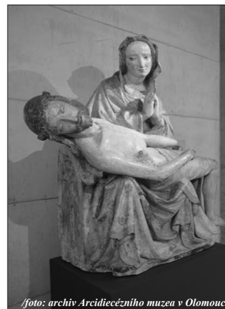
Gotická Pieta z Lutína (přibližně z r. 1400)