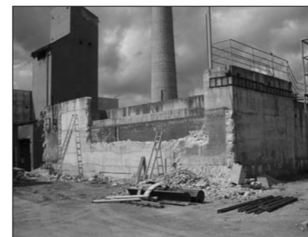
Objekt hrubého předčištění před rekonstrukcí

Je nutno připomenout, že současně s rekonstrukcí ČOV byla provedena i rekonstrukce přečerpávací stanice (rotundy) v Lutíně. Ta byla rovněž osazena novou