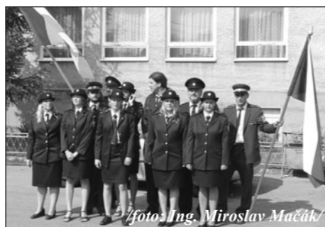
Členové SDH Třebčín před radnicí v Brehách