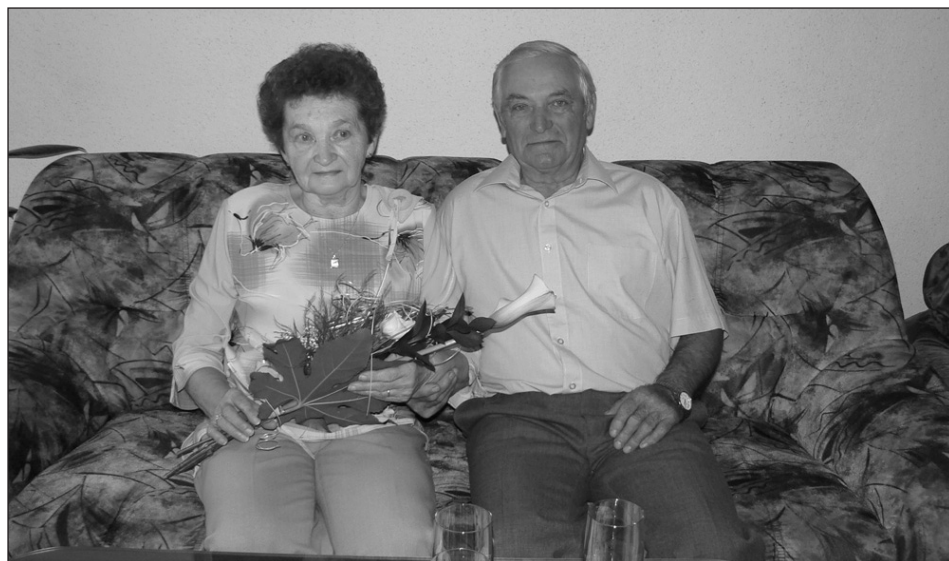
50 let společného života

Narozeným dětem přejeme, aby jejich příští dny a cesty byly plné slunce a pohody.