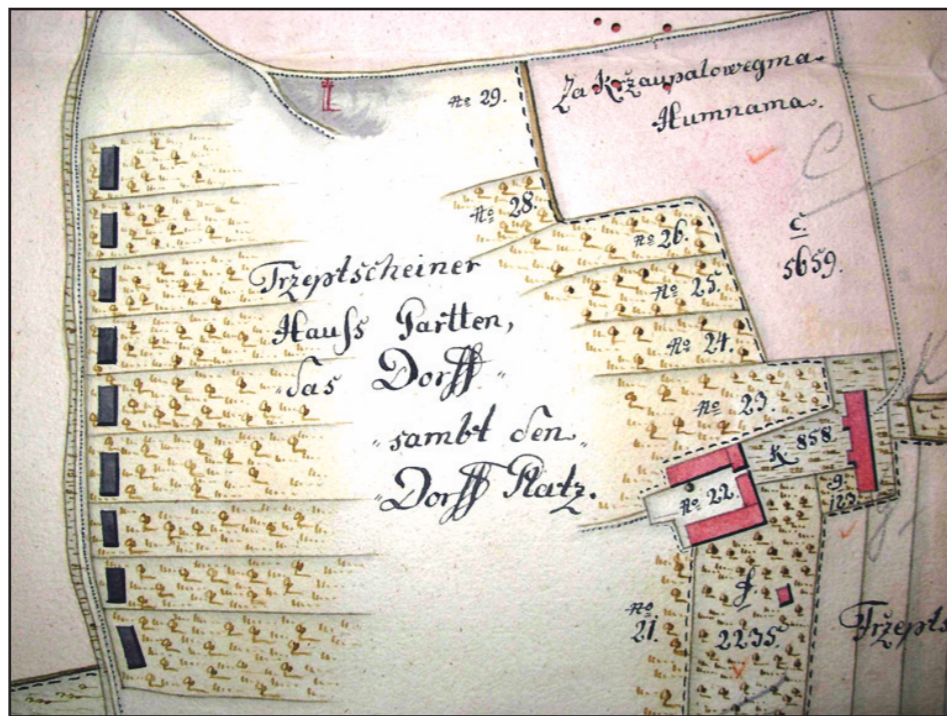
/foto: výřez z mapy Třebčína roku 1783, nahoře boží muka v místě dnešních domů č.p. 23-25/

Kdy byl v Třebčíně postaven první kříž, nevíme. Ty nejstarší byly často ze dřeva, takže se nám nedochovaly – ostatně jejich pomíjivost vedla brzy k pořízení kamenných. Do zákresu Třebčína na mapách tzv. 1. vojenského mapování z šedesátých a osmdesátých let 18. století se dostaly dva kříže a dvoje boží muka. Zde ale nemuselo jít o zachycení všech křížů v obci a navíc to nevypovídá o jejich stáří. Tyto mapy byly často doplňovány, takže ani časové vřechení nemusí odpovídat počtu křížů. Kříže stály přibližně v místech těch dnešních na Kaplické (tzv. černý) a na Olšanské (tzv. červený), jedna boží muka stála na návsi v místě dnešní kapličky a jedna v místě dnešních domů č. p 23-25. Podle (tentokrát přesného) soupisu sakrálních památek v olomoucké arcidiecézi z osmdesátých let 18. století byly v Třebčíně dva kříže, jedna boží muka a zvoněk. Zde je jasné pouze umístění zvonku, který se nacházel v místě dnešní kaple na návsi. U něj byl (slovy tehdejší obecní rady) „na tom místě, kde až posavad čest a chvála pánu Bohu se vzdává“ v roce 1770 postaven nový dřevěný kříž s figurou ukřižovaného Krista. To znamená, že zde na návsi bylo už od nepaměti místo, kde kolemjdoucí nebo poutník spočinul, zastavil a pomodlil se nebo alespoň pokřičoval a je to první