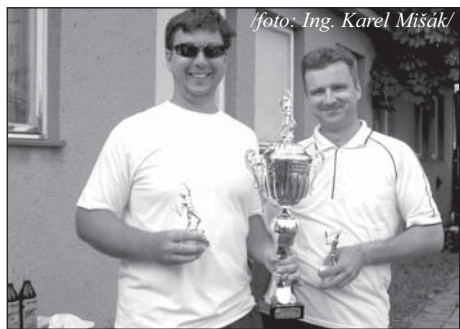
Vítězové s pohárem