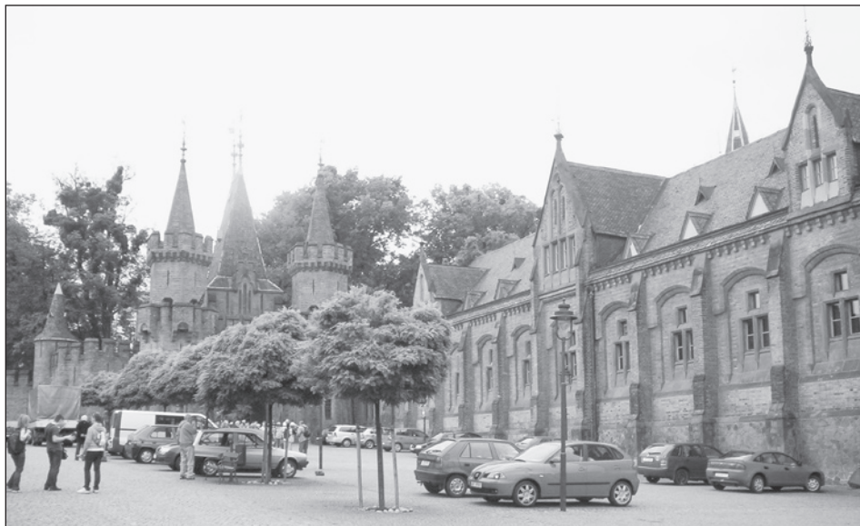
Hradec nad Moravicí

koneckonců není divu, když její strop tvořilo dva a půl metru železobetonu. Po válce byly činěny pokusy o rozbití těchto pevnůstek. To se však nepodařilo, ani když byla na objekt opakovaně shozena letecká puma obsahující jednu tunu výbušniny. Beton unese tíhu šesti set kilogramů na centimetr čtverečný. Když nacisté po obsazení Sudet prozkoumali československé opevnění, konstatovali, že kdyby tyto pevnosti museli dobývat, znamenalo by to pro ně v první útočné vlně stoprocentní ztráty.