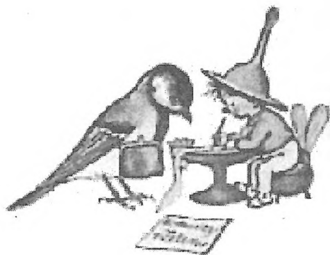
Tomáš "Stoupa" Pospíšil