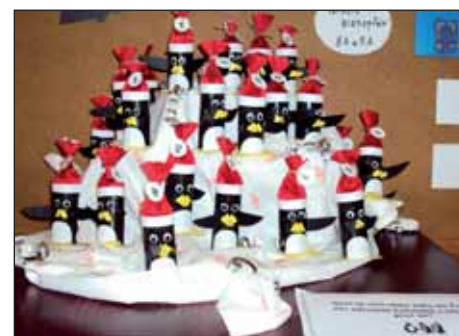
Adventní kalendář – tučňáci

Své práce zde vystavili žáci všech tříd. Návštěvníci tak měli možnost zhlédnout nepřeberné množství vánočních ozdob, svícnů, čertů, andělů, přáníček a novoročenek, které děti vytvořily z rozmanitých materiálů - papíru, přírodnin, skla, textilu i keramiky.