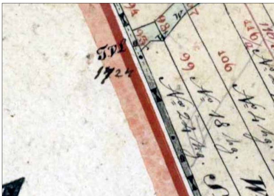
Hraničník u „skal“ s letopočtem 1724.