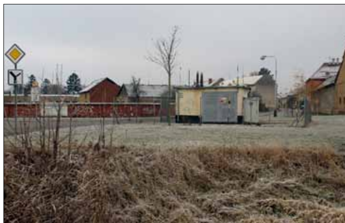
Plavisko nahradila rovná zatravněná plocha.