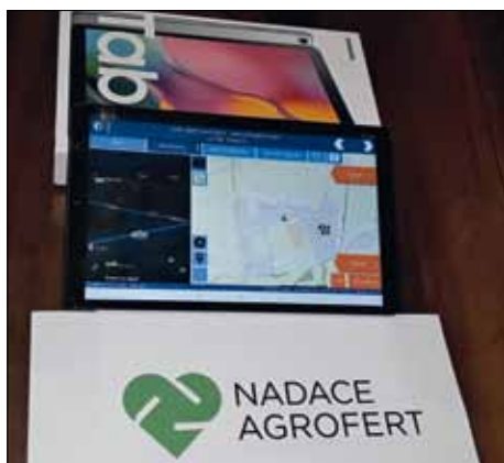
Tablet GINA pro JSDH.

Jednotka Sboru dobrovolných hasičů v Třebčíně získala díky příspěvku od Nadace Agrofert ve výši 20 000 Kč výjezdový tablet GINA. Zbývající část ceny zařízení poskytl zřizovatel jednotky, kterým je Obec Lutín. Tablet bude umístěn do zásahového vozidla CAS 25 RTHP, které vyjíždí ke všem událostem.