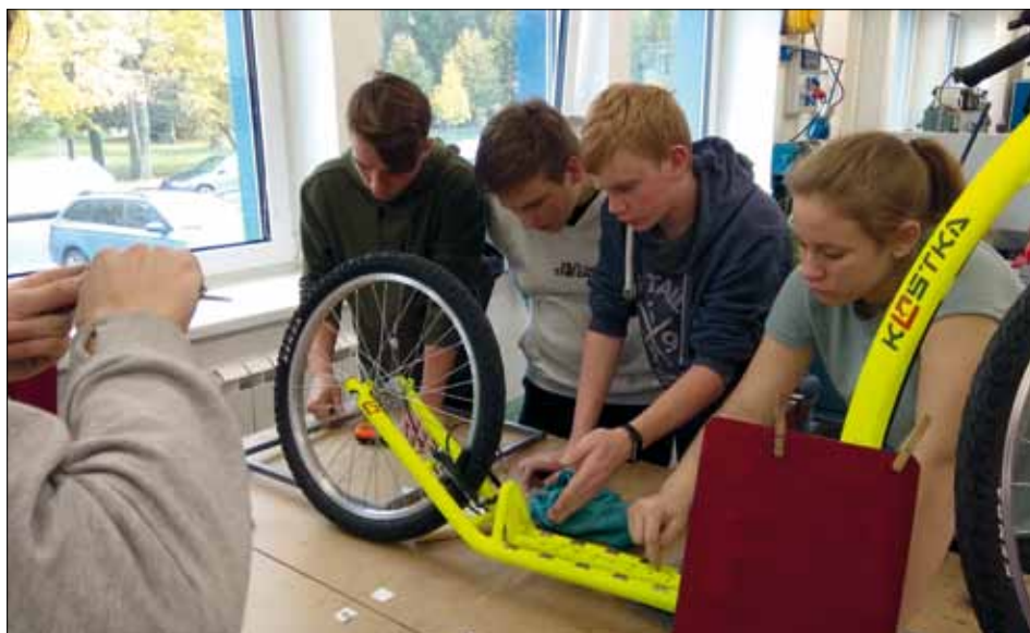
Práce na společném projektu – koloběžce.

Práce se oběma týmům zdařila a výsledky našeho snažení byly představeny na závěrečné prezentaci za účasti žáků a učitelů z Wetzlaru, ředitele naší školy