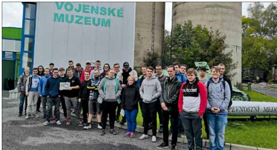
Vojské muzeum v Králíkách je věnované armádě a obraně státu.