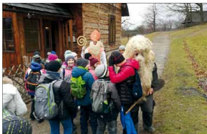
V rožnovském skanzenu.