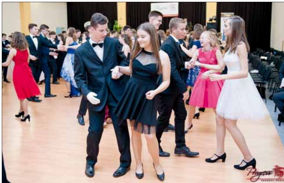
Co se v kurzu naučíš, na parketu jako když najdeš.

Koncem listopadu proběhla závěrečná kolona, kde naši tanečníci předvedli své