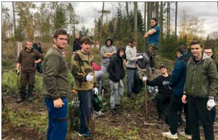
Když je třeba, dokážou chlapci odvést kus dobré práce.