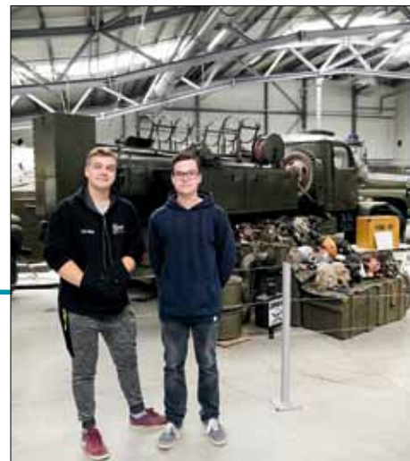
V muzeu je mnoho zajímavých exponátů.