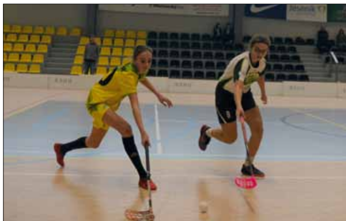
Naše starší žákyně bojovaly v Jeseníku s elánem a vírou ve vítězství.