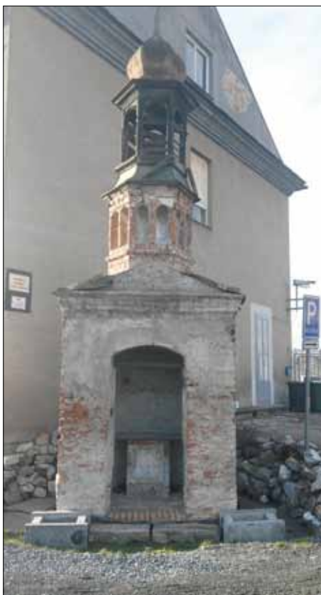
Kaplička před renovací.