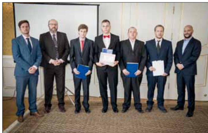
Noví držitelé Čestného uznání HK ČR.