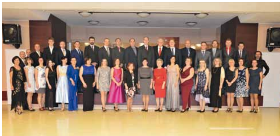
Spokojení účastníci zvládli i „country“.