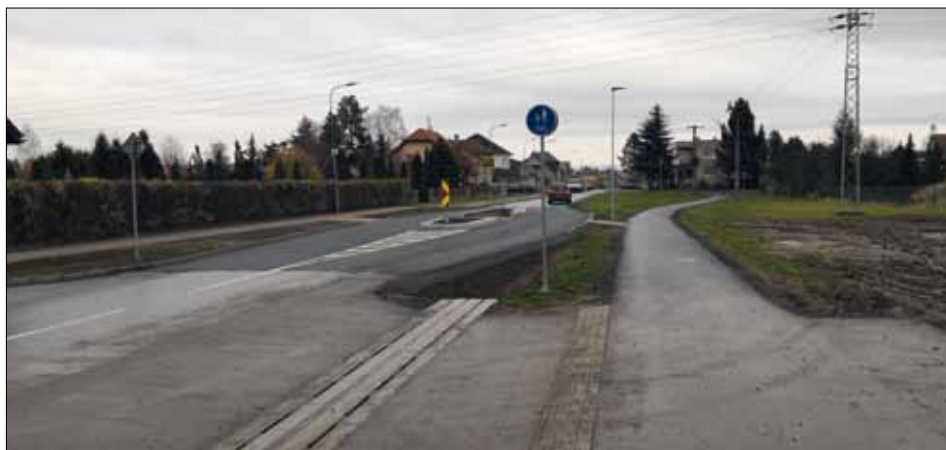
Ostrůvek v Třebčínské ulici – pohled od Třebčína.