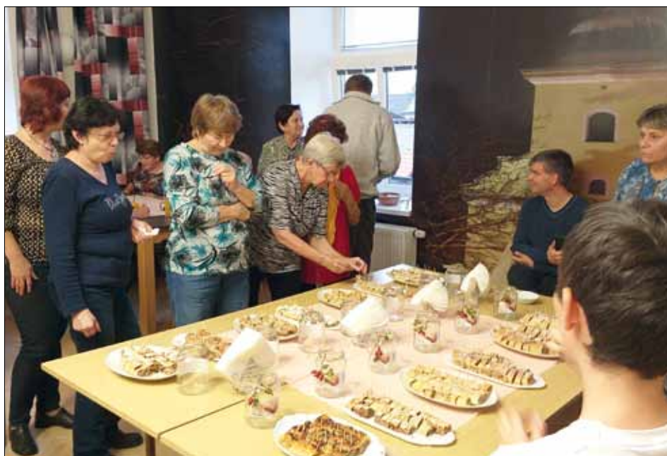
Ochutnávání bylo sladké – rozhodování těžké.

Každý ze soutěžících přispěl opravdu velkým množstvím závinu, tudíž bylo možné (při případných pochybách) ochutnávat vícekrát stejný vzorek. O tom, kdo upekł ten nejlepší, rozhodovali samotní návštěvníci akce, a to takto: