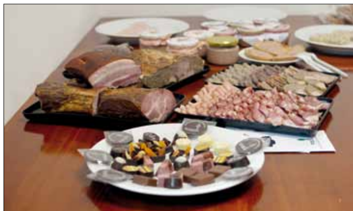
Masné lahůdky z „Uzenin od Zajíčků“.