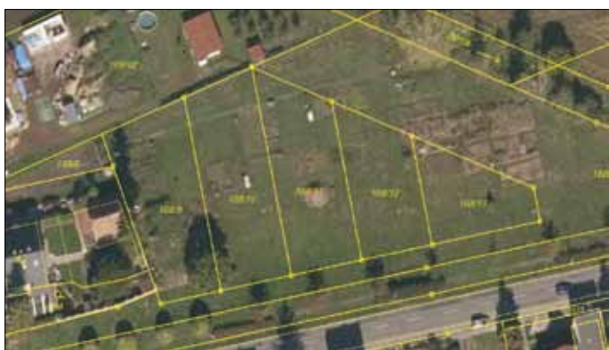
Stavení pozemky v Olomoucké ulici.