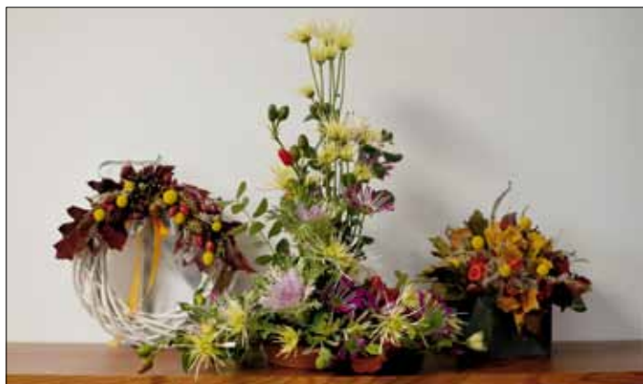
Květinová krása od firmy „Květiny Bouzov“.