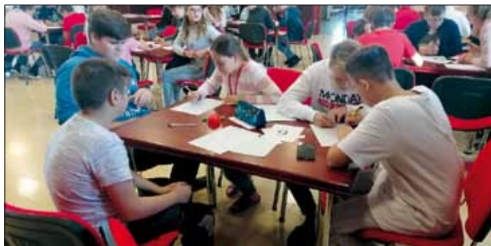
Nevyhráli, ale příště to napravi!