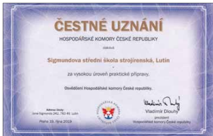
Čestné uznání HK ČR má už 122 našich absolventů.