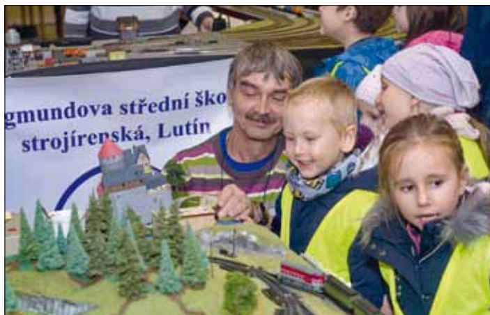
Vystavené modely nadchly hlavně malé návštěvníky.