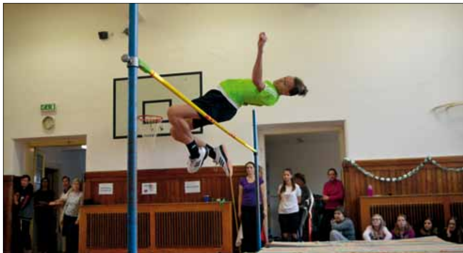
„Vánoční laťka“ v Hněvotíně.

Florbal není jediným sportem, kterému se v prosinci věnujeme. Velmi oblíbená je i soutěž ve skoku vysokém Vánoční laťka . Letos se jí ve školním kole účastnilo téměř čtyřicet dětí a vítězům jsme rozdali čtyři poháry.