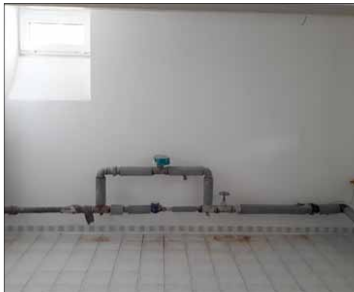
Prostory sklepa po skončení prací.