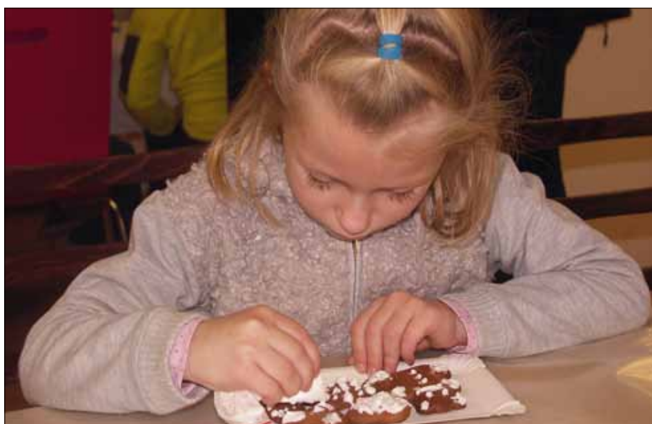
Zdobení perníčků je umělecká práce.