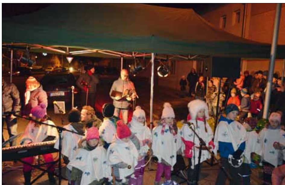
Po recitaci a koledách zazářil vánoční strom u kaple sv. Floriána.