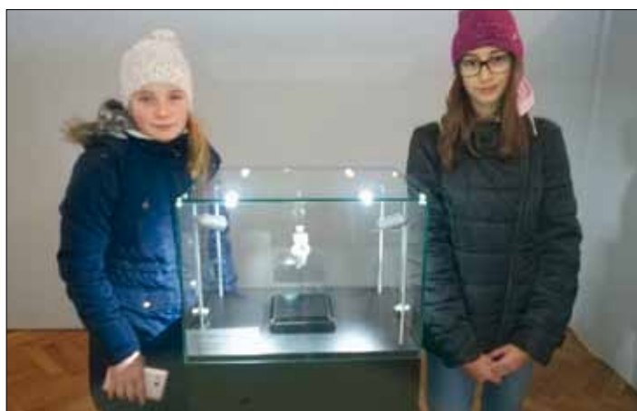
„Strážkyně“ kopie drahocenné památky.