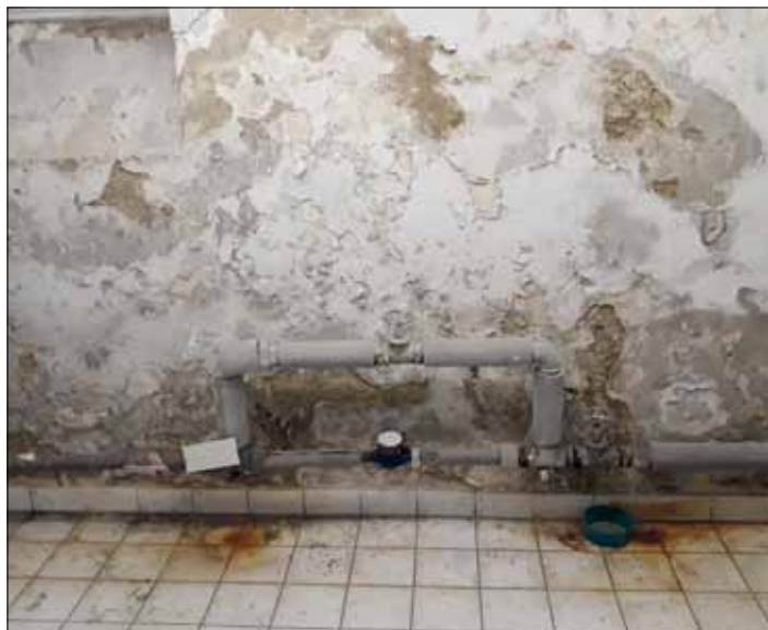
Sklep SÚ před sanací.