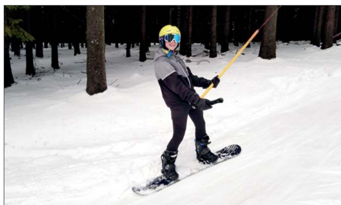
Kdo by si nepřál takovou zimu?