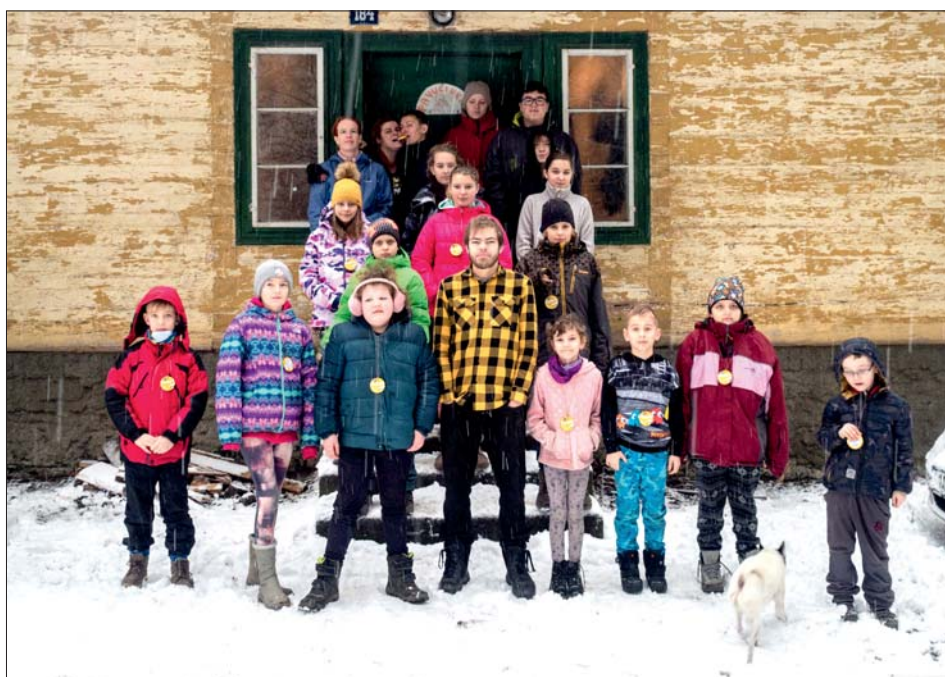
Na Pavučince jsme si poradili i bez mobilů.