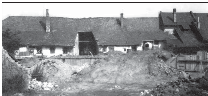
Statek č. 5 z pohledu ze zahrady.

Dnešní stará fotografie není příliš historická, ale pro většinu spoluobčanů je víceméně „exotická“. Staré chalupy s prolomenými střechami měly č.p. 4 a 5, byly