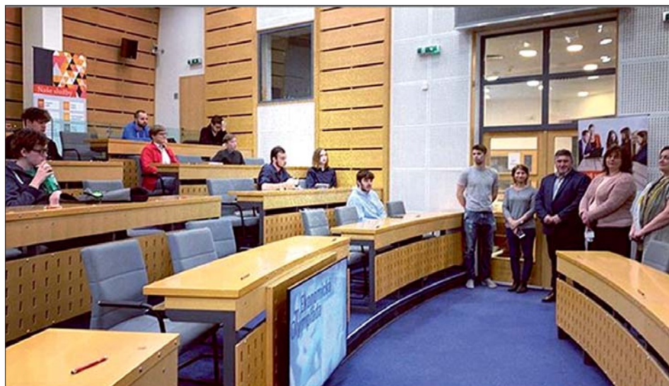
Na výsledky si účastníci krajského kola musí počkat.

Během prosince proběhlo školní kolo. Testování ve školním kole probíhá on-line formou. Testovací systém náhodně