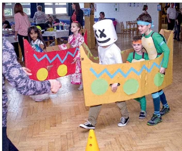
Všechny děti se pořádně vydováděly při hrách a soutěžích.