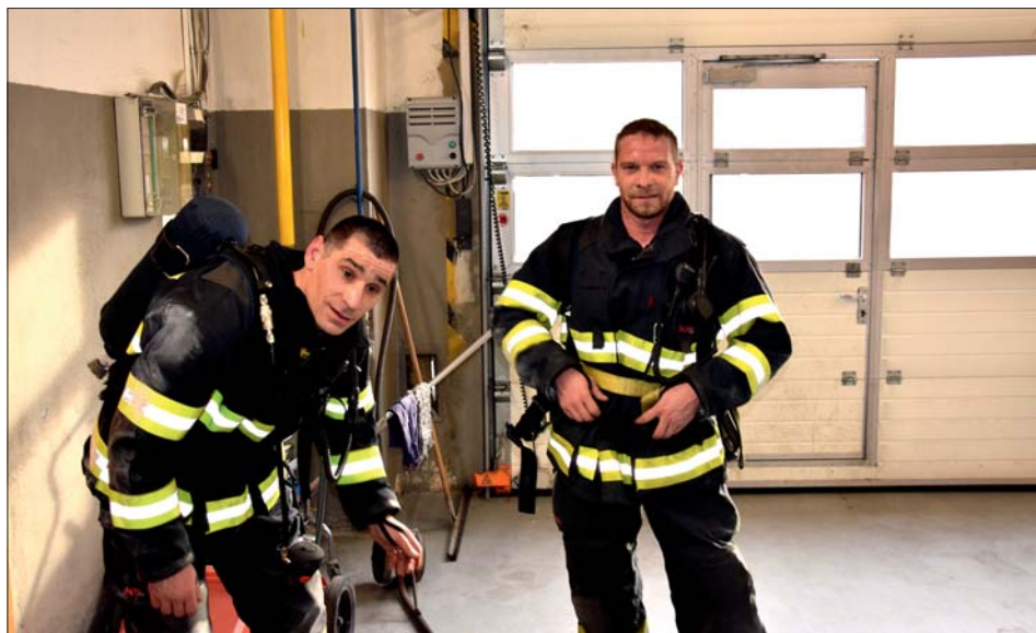
Výcvik v dýchací technice není žádná legrace.