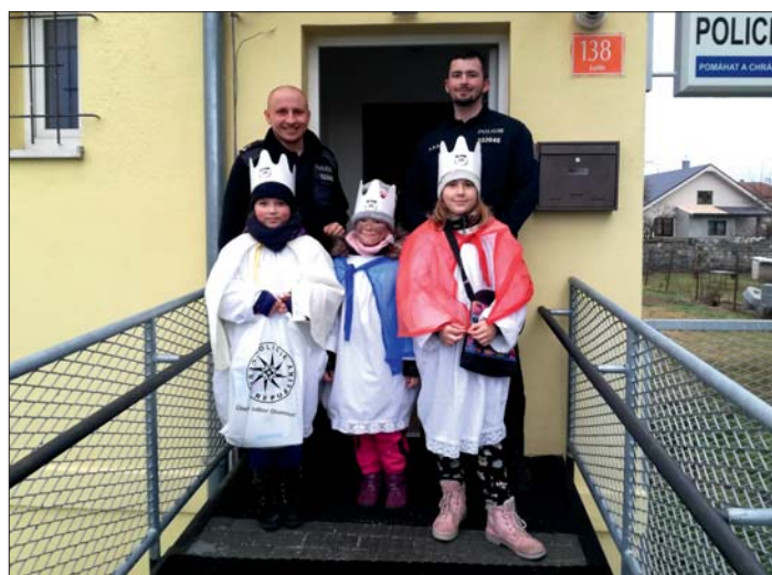
Lutínští „králové“ nevynechali ani naše strážce pořádku.