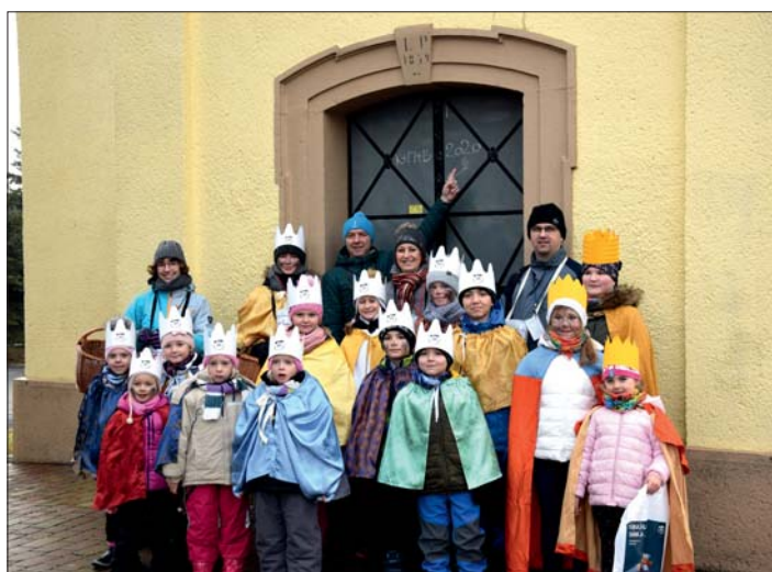
Třebčínští „králové“ s doprovodem.