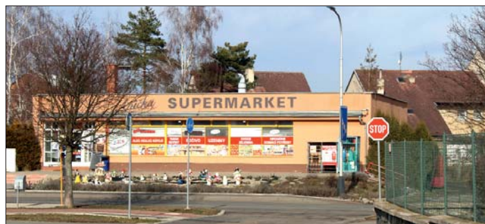
Supermarket „Anička“ je soukromá prodejna.