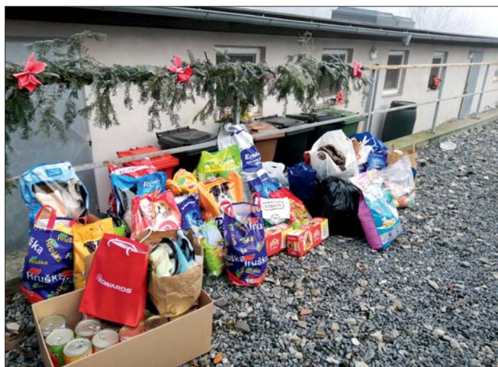
Pejsci z útulku v Čechách pod Kosířem dostali bohatou nadílku.

Už pět let se v prosinci koná v naší škole sbírka pro pejsky z útulku v Čechách