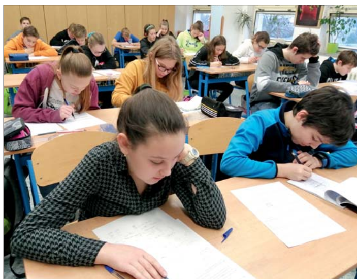
V matematické olympiádě si žáci museli poradit i s náročnými úkoly.