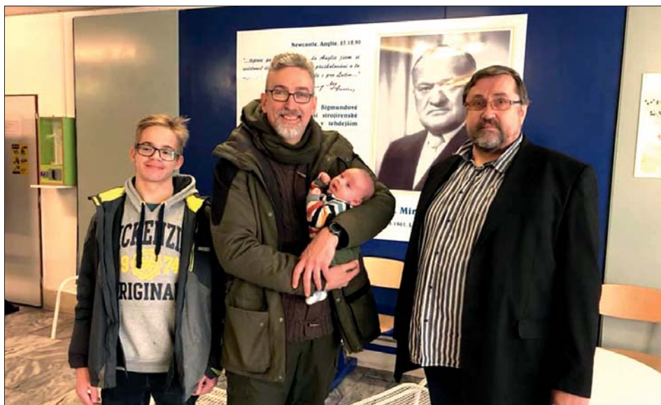
Primátor Olomouce v roli starostlivého otce.