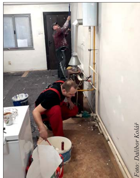
Denní místnost už je „jako malovaná“.