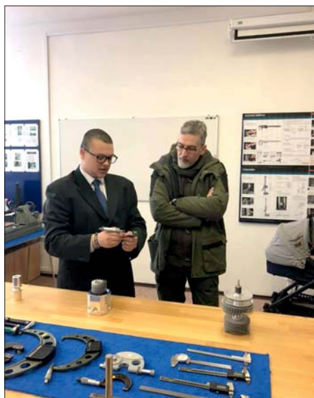
Laboratoř technických měření.

Během prosince a ledna proběhly v naší škole již tradiční „dny otevřených dveří“. V tyto dny mohli zájemci z řad veřejnosti navštívit všechny budovy školy. Velký zájem byl především o prostory školních dílen, které jsou díky předložské rekonstrukci pro veřejnost atraktivní.