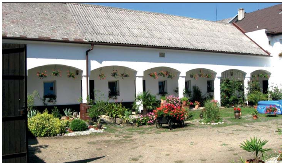
Nad arkádami se zachoval kamenný svědek doby vzniku hospodářské přístavby z r. 1896.

* arkáda – zděný oblouk nesený sloupky, podpírající prodlouženou část střechy