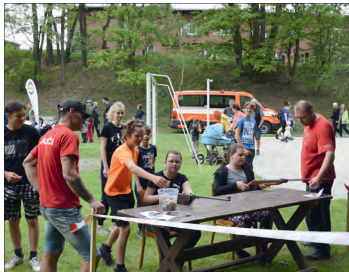
Střelba ze vzduchovky