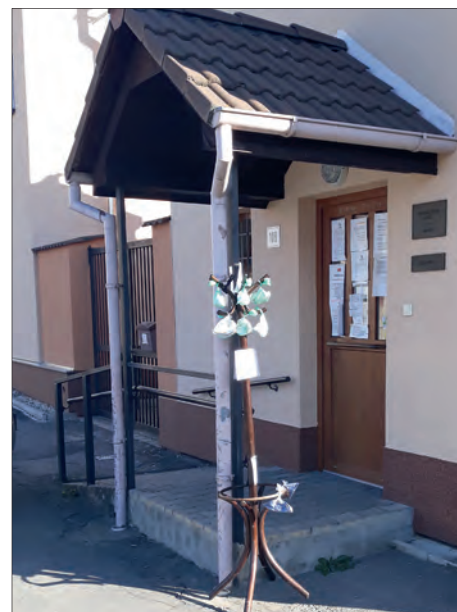
Rouškový strom u KSZ v Třebčíně byl k dispozici občanům.