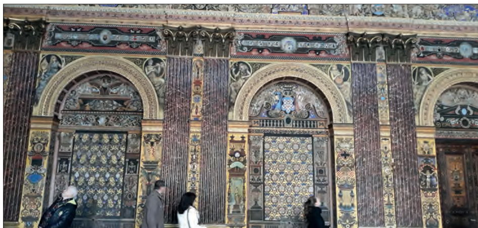
Výzdoba a malba na bočních stěnách.