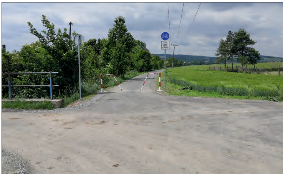
Cyklostezka do Slatinic (vlevo ul. Pohoršov, vpravo polní cesta do Luběnic).

Konečně hotová je také cyklostezka do Slatinic , její slavnostní otevření proběhlo 18. června. Délka vybudované části je 1,3 km, když připočteme úseky účelových komunikací, které v minulosti dostaly nový asfaltový kryt, máme pro cyklisty a chodce více než dva kilometry bezpečné trasy. Cyklostezku realizovala firma SWIETELSKI stavební s.r.o. za cenu 5,5 mil. Kč, z toho 4,5 mil. Kč zaplatila dotace ze Státního fondu dopravní infrastruktury. Jakub Chrást