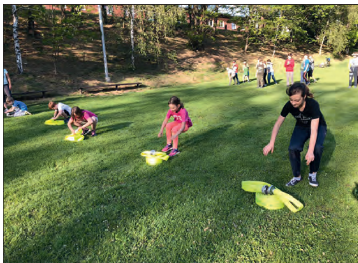
Rozhazujeme, zapojujeme a motáme.