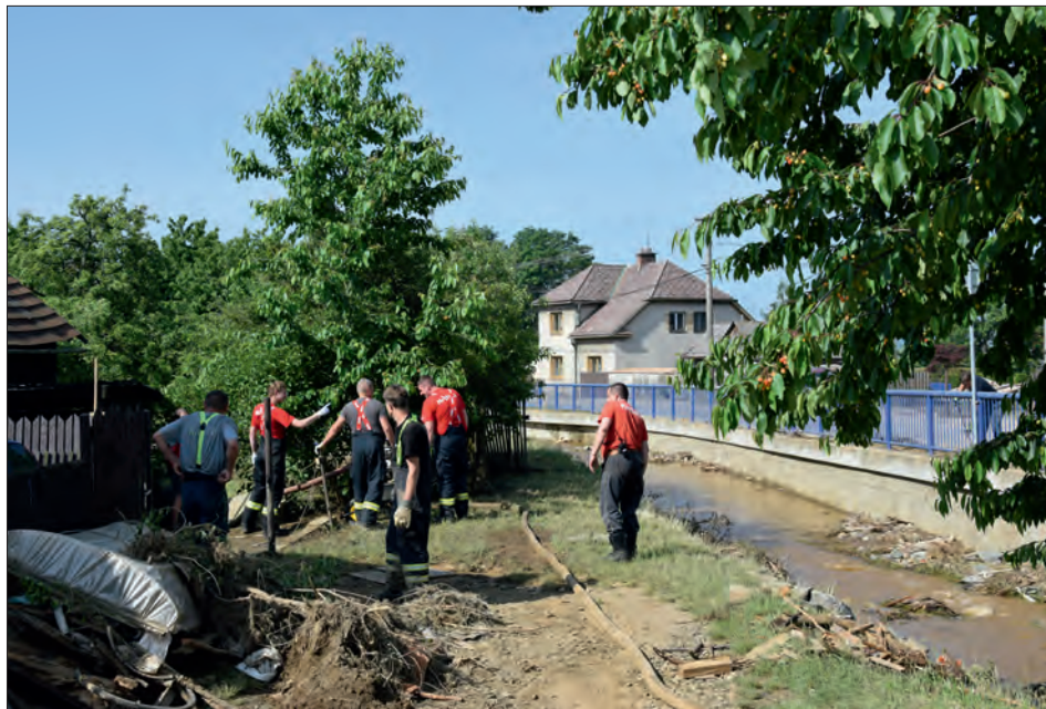
Úklidové práce v Šumvaldu..

Příjemné odpoledne bylo završeno večerním promítáním rodinné komedie „Špunti na vodě“. Těsně po skončení