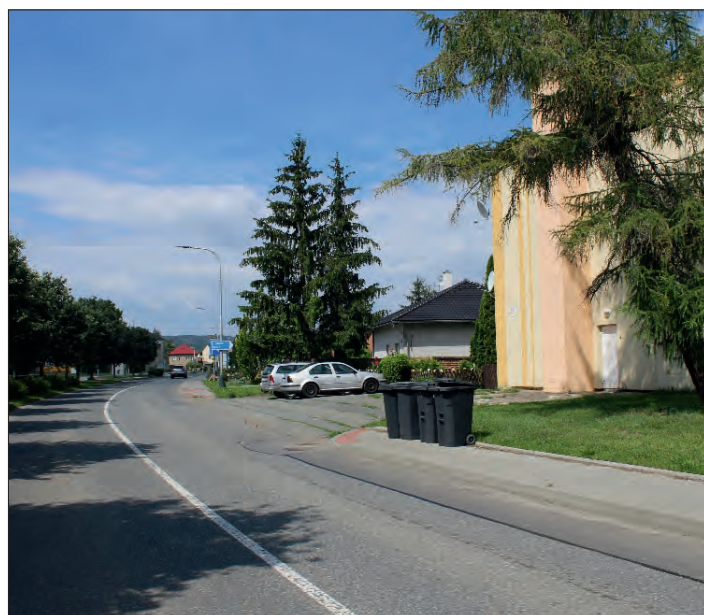
Dnešní podoba ulice.