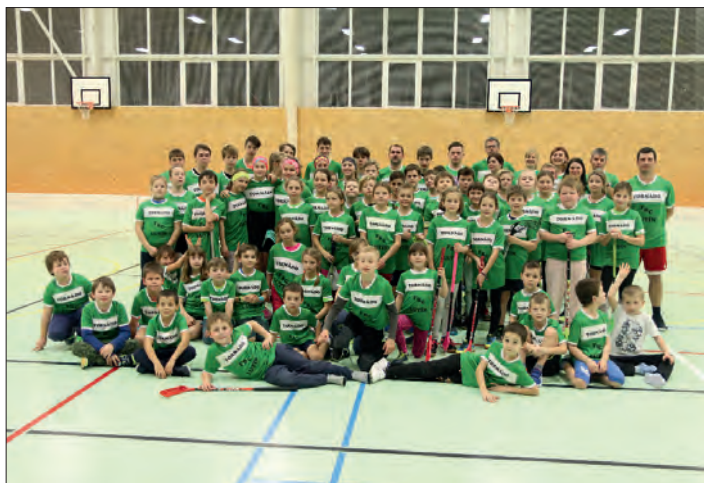
Zájem o florbal je stále velký.

Ale rozhodně nepatříme k outsiderům! Šest let po sobě bojují děvčata lutínské školy v celorepublikovém finále základních škol ČEPS CUP, dokonce čtyřikrát už vyhrála zlatou medaili. Minimálně do krajského finále se vždy podaří probojovat v přece jen větší konkurenci i družstvu chlapců. Díky těmto úspěchům zviditelňujeme Lutín na mapě republiky.