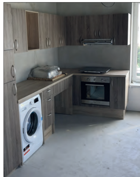
Pohled do bezbariérové kuchyňky komunitního bytu.