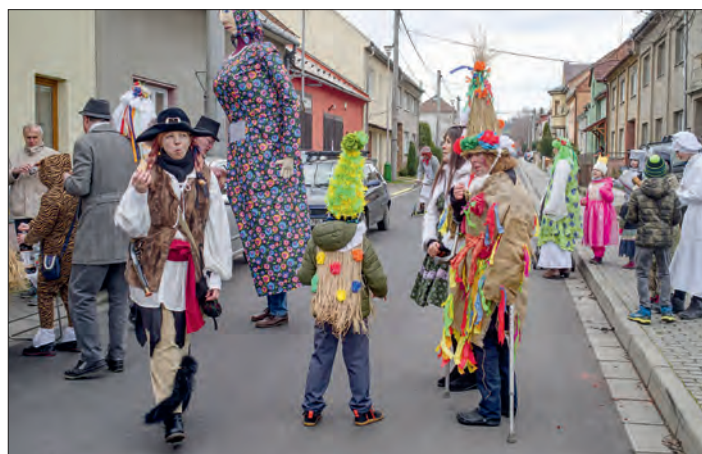
Ostatkový průvod masek byl jako vždy veselý a rozpustilý.