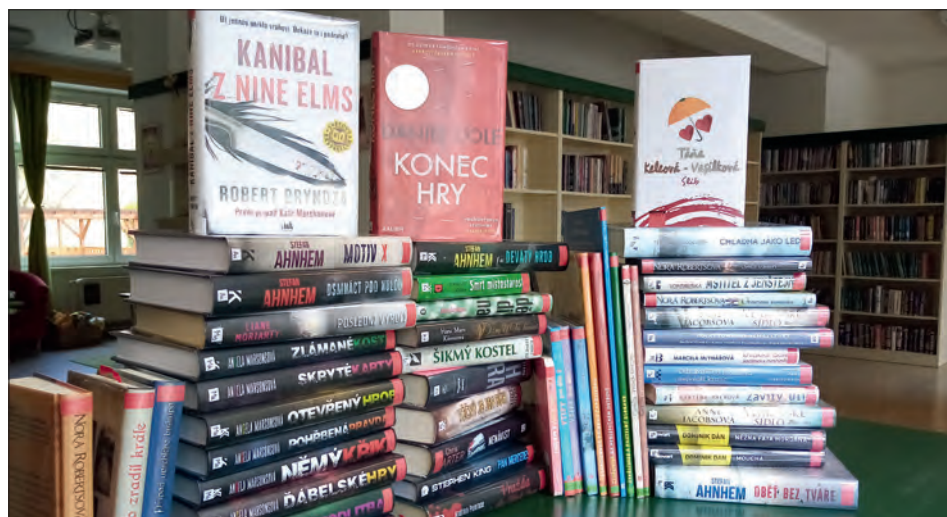
Čerstvá zásilka knih dorazila také do Třebčína.