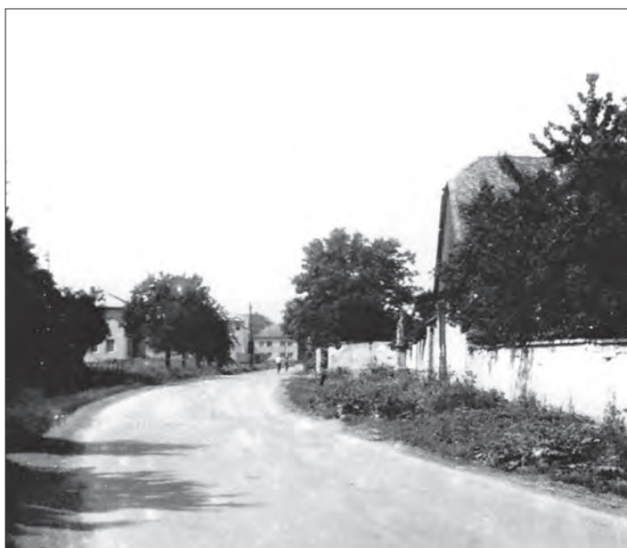
Školní ulice před 48 lety.