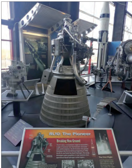
Výuka matematiky v TEAMS

Výuka on-line je v plném proudu. Většina pedagogů pracuje v TEAMS, používáme také aplikaci Bakalář. Učitelé zadávají