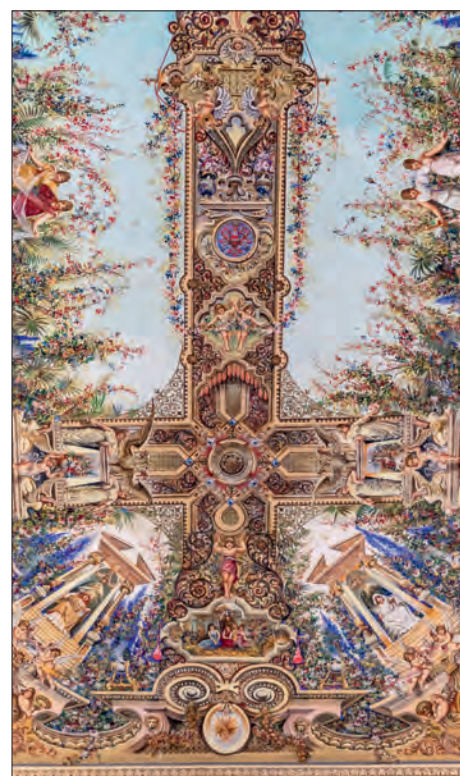
Pohled na stropní výzdobu.