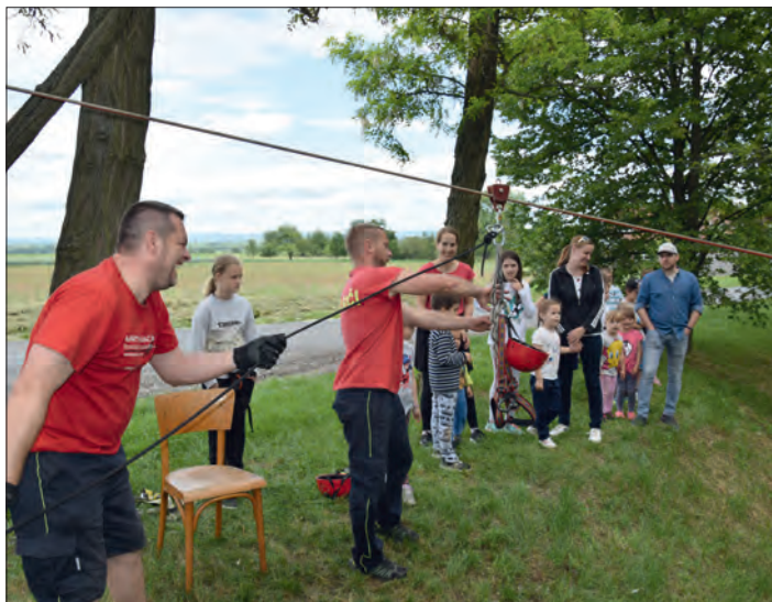
Sjíždění po laně.

Hasičům patří dík za perfektní organizaci akce a svatému Petrovi za to, že počkal s deštěm, až bude po promítání ☺.