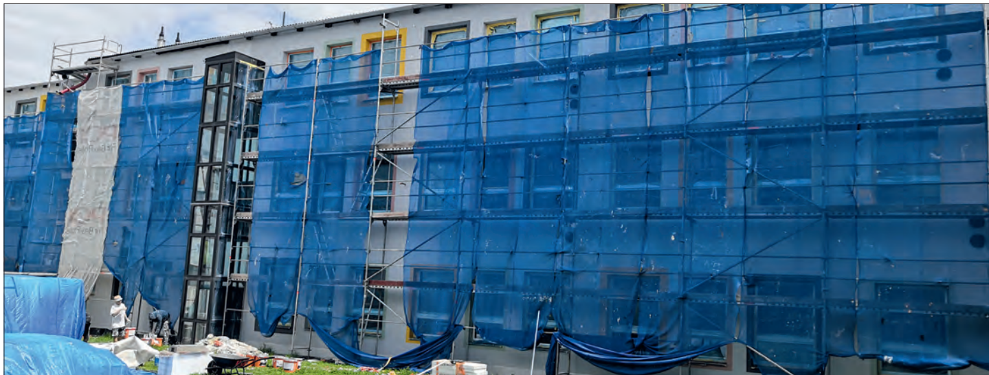
Zadní část nové budovy školy – pohled ze dvora – zatím tají svůj nový vzhled.

nového domu pro seniory. Fasáda domu je kompletně hotová, z větší části jsou hotové i vnitřní omítky a momentálně probíhá montáž SDK podhledů a příček, zařizovacích předmětů a nového výtahu. Hotové je také nové parkoviště v ulici Břízová, které bylo podmínkou stavebního povolení. Smluvní termín dokončení je stanoven na konec září a zdá se, že by ho nic nemělo ohrozit.