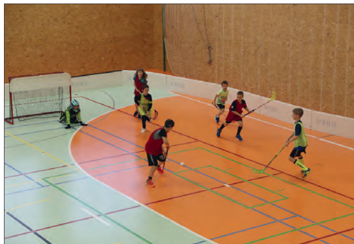
Trénujeme, kde se dá.