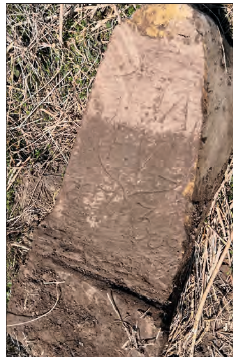
Lutínský „hraničník“ nalezený při stavbě cyklostezky z Lutína do Slatinic.