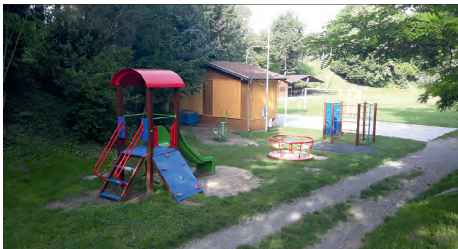
Nové hrací prvky v Ohradě.