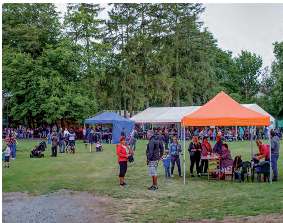
Loňský rockový festival nabídl kromě hudby také pivo a další produkty z našich pivovarů.

Kulturní komise SDH Třebčín TJ Sigma Lutín