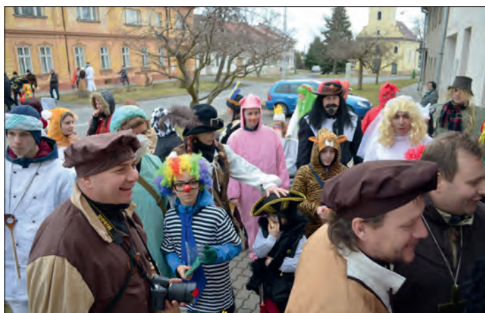
Bavili se všichni – v masce i v „civilu“.