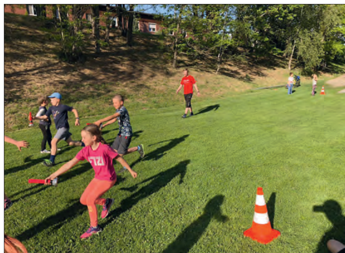
Jedna z disciplin hry „Plamen“.