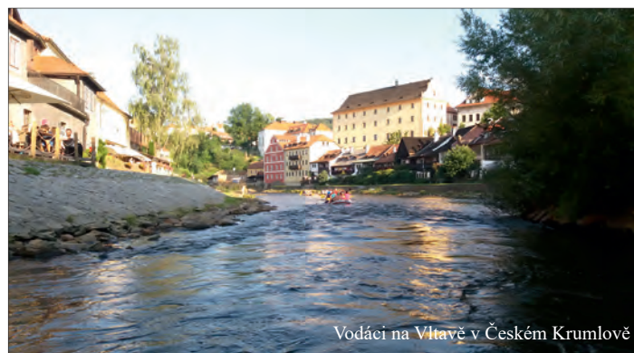
Vodáci na Vltavě v Českém Krumlově

U nás doma je stejně krásně jako v daleké cizině.