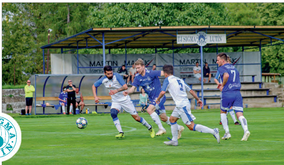
Hraje se dál!

Soutěž by se měla rozběhnout od 9. srpna ve stejném složení i rozlosování jako v nedohrané sezoně, začínat bychom měli tedy 9. srpna s FC Dolany. Příprava startuje 1. čer-