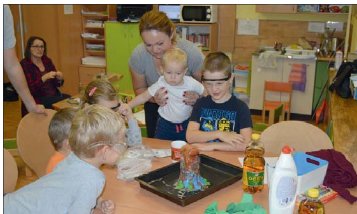
V Klásku je pořád co poznávat a tvořit.

Přidaly se k nám i maminky z RC Pohádka z Náměště na Hané. Děti si užily jak cestu vlakem, tak samotný program „Putování s Ferdou Mravencem“. Prozkoumaly mravence lupou, vyrobily domečky pro chrostíky a lovily sítkami v tůňkách drobné vodní živočichy.