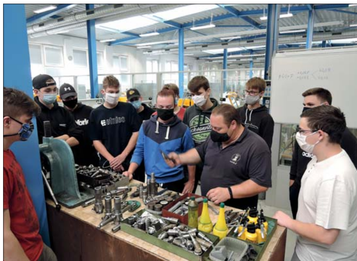
Spolupráce školy a dílen je výborná a pro budoucí strojaře nezbytná.