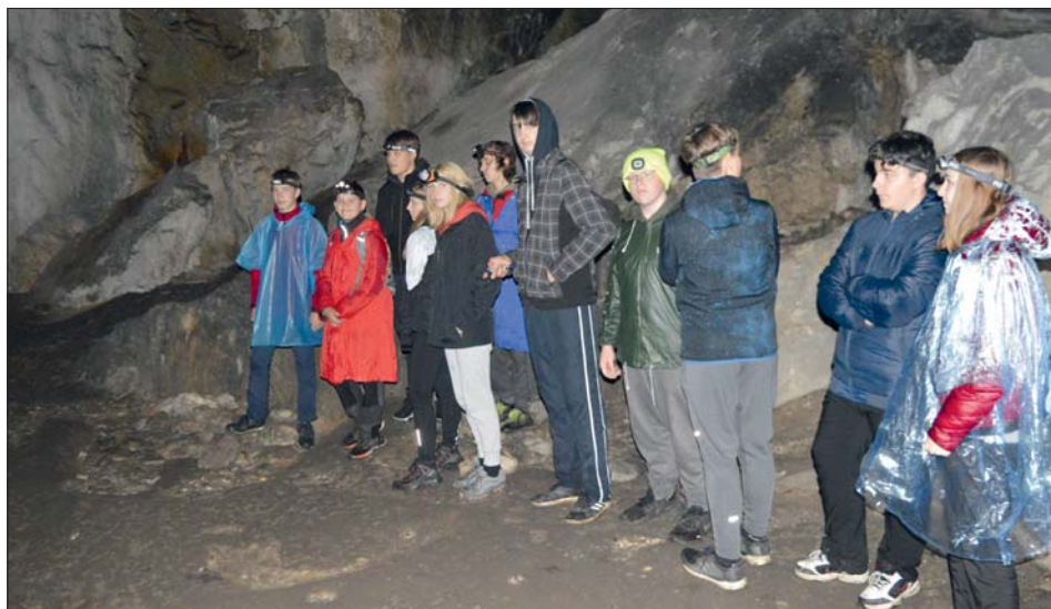
Přírodní divy a zajímavosti Moravského krasu obdivují tisíce domácích i cizích návštěvníků.

Letos byl konec září nadprůměrně deštivý, což se ale nakonec pro naši exkurzi ukázalo jako velké plus. Žáci zvládli i drobné mrholení, které nás sice celý den provázelo, ale neznemožnilo nám vše absolvovat. Kde voda v minulých letech pomalu vtékala do podzemí, letos burácel vodopád, kde jsme v minulých letech přeskočili potůček, museli jsme absolvovat dobrodružné překonání řeky.