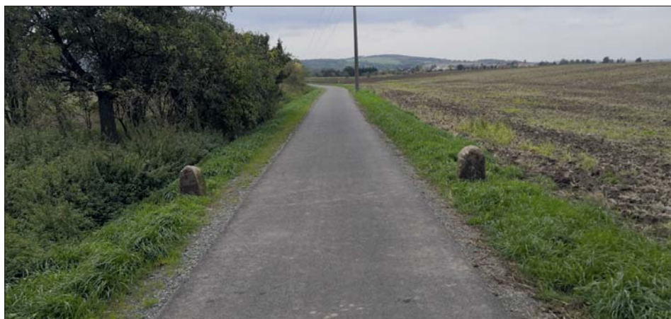
Hraniční kameny najdete na okraji cyklostezky.