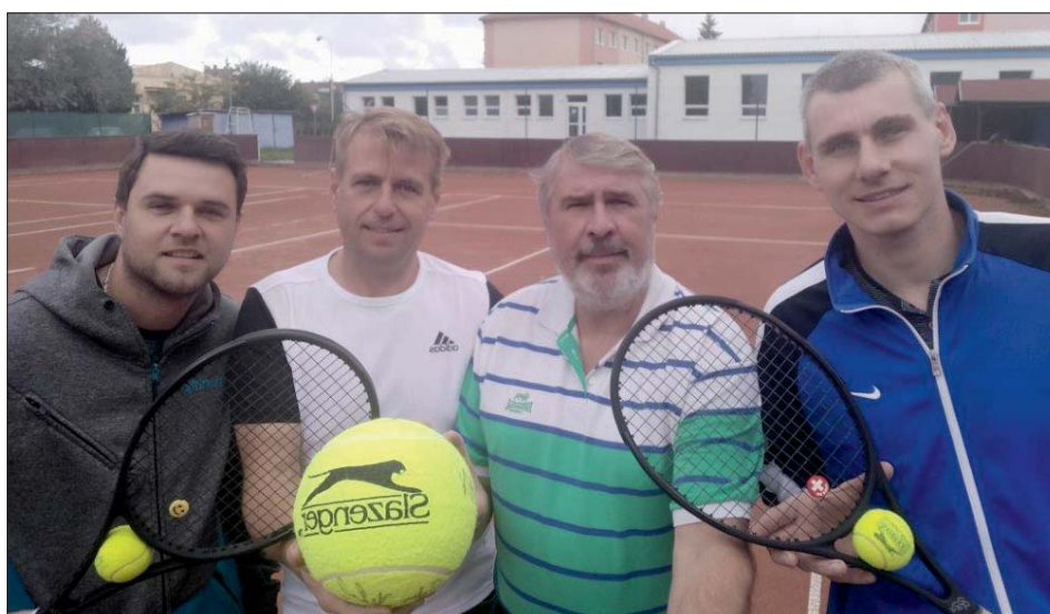
Hráčům „bílého“ sportu nabízíme v Lutíně dobré podmínky.