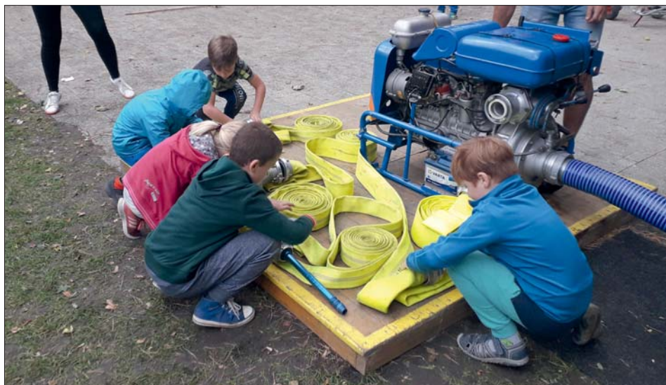
Příprava na soutěž musí být důkladná.

Hlavní disciplinou podzimní části příprav byl naplánovaný požární útok. Je vyvrcholením požárního sportu a ne nadarmo se mu