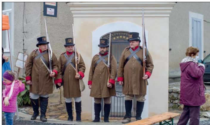
„Císařští mušketýři“ zahájili a ukončili svěcení kapličky výstřelem z mušket.