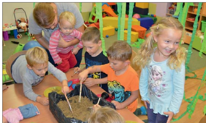
Fota: Monika Janíková