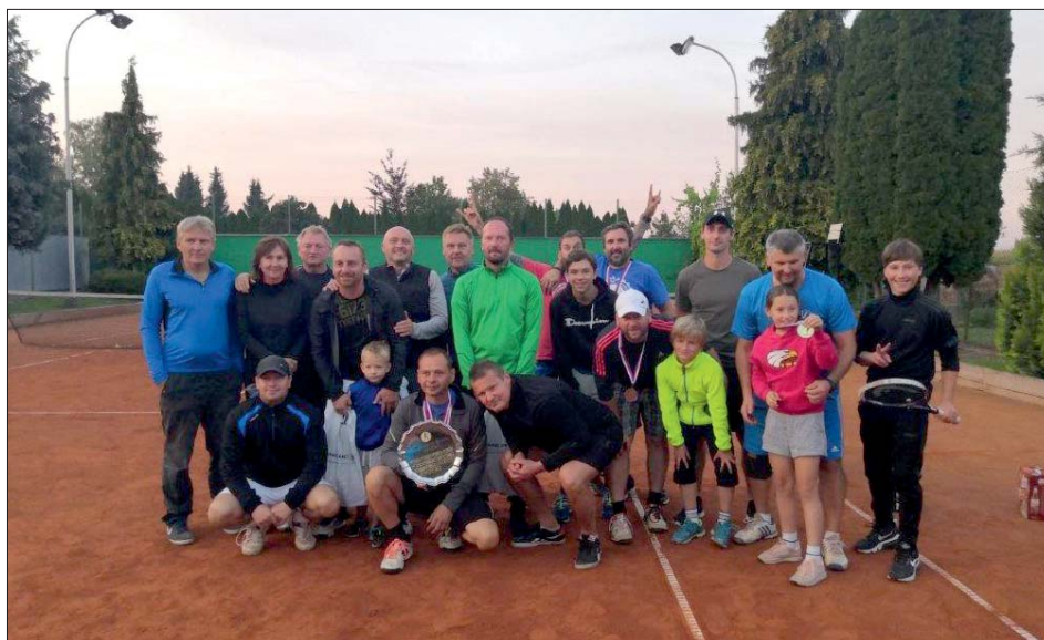
Putovní „Tvarůžková mísa“ má držitele na další rok.

= zkrácený způsob počítání v tenise před koncem setu – pozn. redakce/