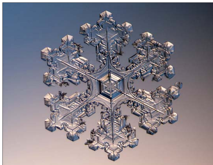
Sněhová vločka se podobá šperku.