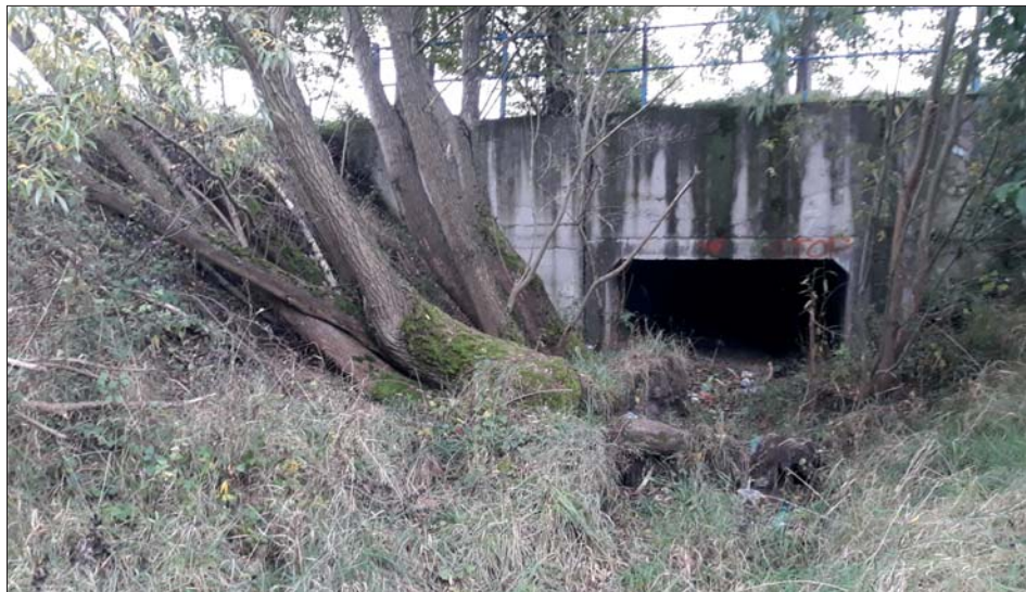
Stav potoka před soutokem Deštného a Slatinky je kritický.

(OPŽP – Operační program Životní prostředí, IZS – Integrovaný záchranný systém)