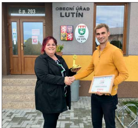
Keramické sluchátko je letos naše.

Obec Lutín uspěla v soutěži „O keramické sluchátko“, kterou každoročně vyhlašuje společnost ASEKOL ve spolupráci s Olomouckým krajem. Jedná se o soutěž, kde je hodnocena výtěžnost odevzdaných vysloužilých elektrospotřebičů v přepočtu na jednoho obyvatele. Mezi odevzdané elektrospotřebiče se řadí například počítače, televizory, rádia, fotoaparáty, videokamery nebo mobilní telefony. Obec Lutín obsadila první mís-