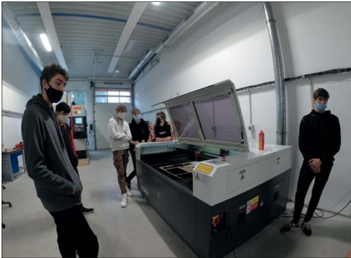
Budoucí strojaři absolvují odborný výcvik na moderním vybavení školních dílen.