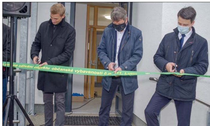
Po přestřižení pásky následovala prohlídka interiéru nového domu pro seniory.