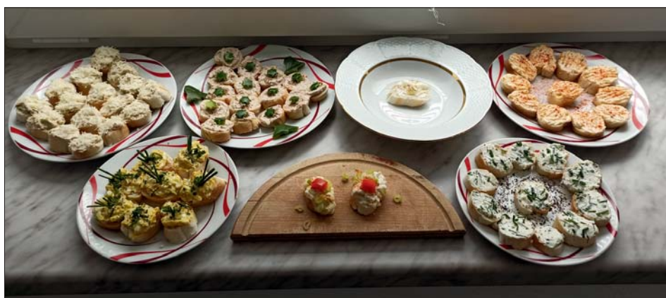
Dobrou chuť přeji „sedmáci“!