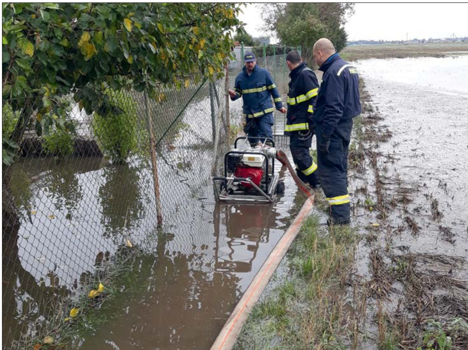
Vodní laguna za lutínským sídlištěm trápí po velkých deštích majitele zahrádek dost často.