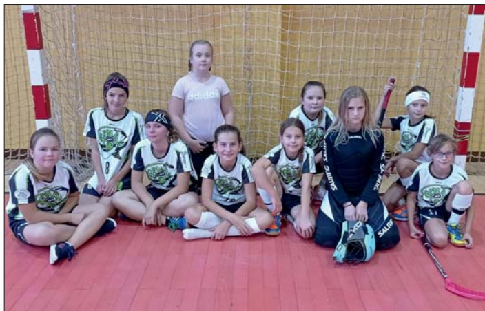
Děvčata i chlapci hrají stále s velkou chutí a nadšením.