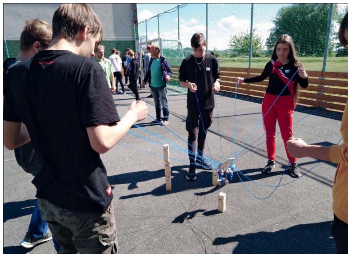
Seznamování probíhalo tentokrát v „domácím“ prostředí.

Každoroční adaptační kurz prvních ročníků proběhl letos ve stanoveném čase od 2. do 4. září, ale na jiném místě.