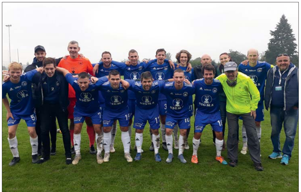
Před novým omezením „uhráli“ deset kol.