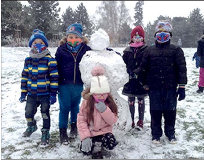
Na mrkev, uhlí a metlu nebyl „materiál“.