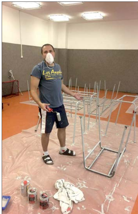
Výuka distanční, třídy prázdné ...