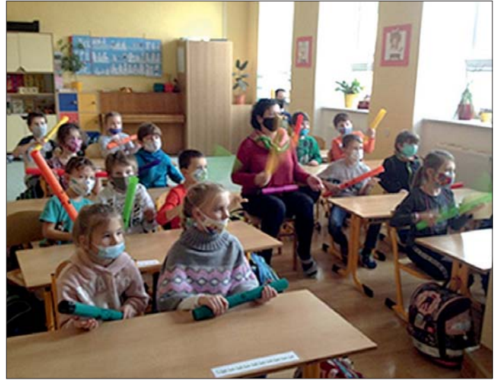
„Hudebka“, jak jsme ji neznali.