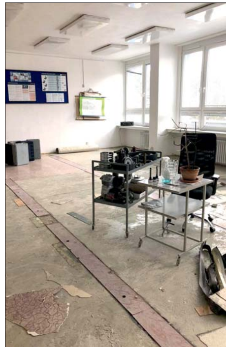
... a škola „vzhůru nohama“.