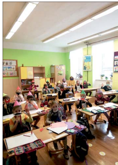
Děti v 1.B chystají „covidový“ masopust.

díky kterému můžeme spolupracovat se všemi žáky. Ti, kteří nemají možnost si materiály doma vytisknout, vyfotit a poslat..., mohou práce vyzvedávat a odevzdávat ve vestibulu školy, ta je otevřená v pracovní dny vždy do 18:00 hodin. Tímto způsobem vydáváme žákům také další učebnice či pracovní sešity. Hned od října docházejí někteří žáci na osobní konzultace do školy, kde se jim věnují učitelé nebo asistenti pe-