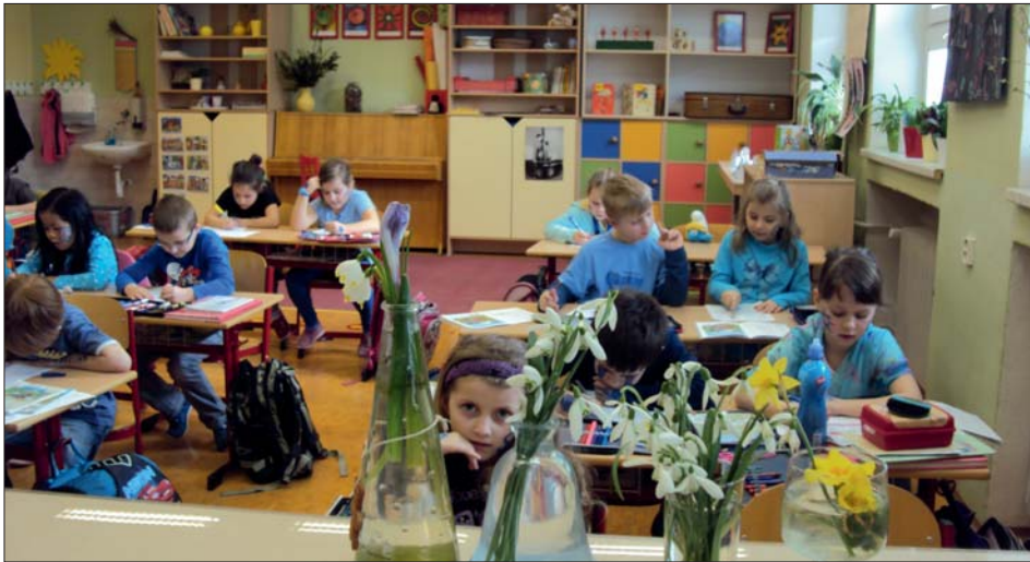
Po normální, „nemaskované“ výuce se stýská nám všem.