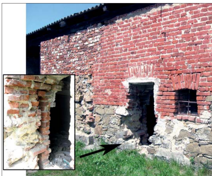
Vnější podoba „ledovny“ s detailem vzduchové kapsy.