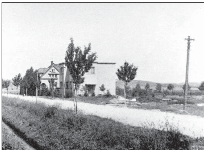
Kdysi osamělé domky č.p. 114 a 129.