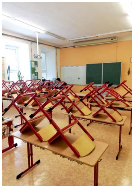
Prázdné učebny stále čekají...