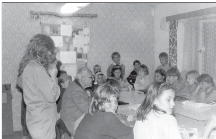
Historický snímek z prvních let DUHY.