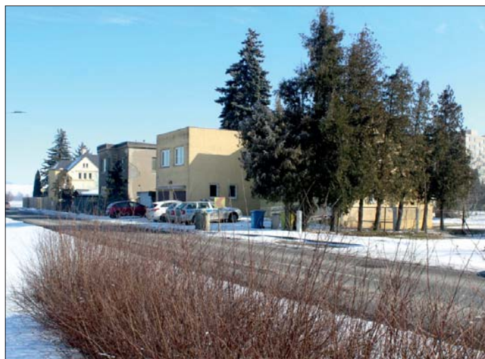
Během let se ulice (dnes Olomoucká) rozrostla.