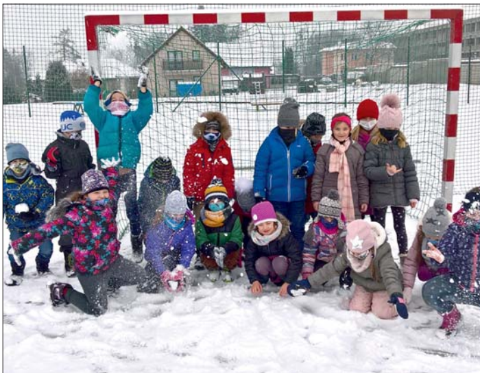
Na sněhu a čerstvém vzduchu byla i všechna omezení snesitelnější.