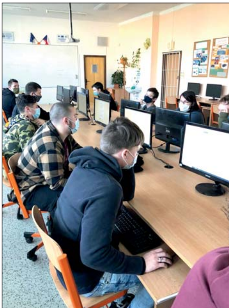
Školní kolo ekonomické olympiády proběhlo opět on-line.