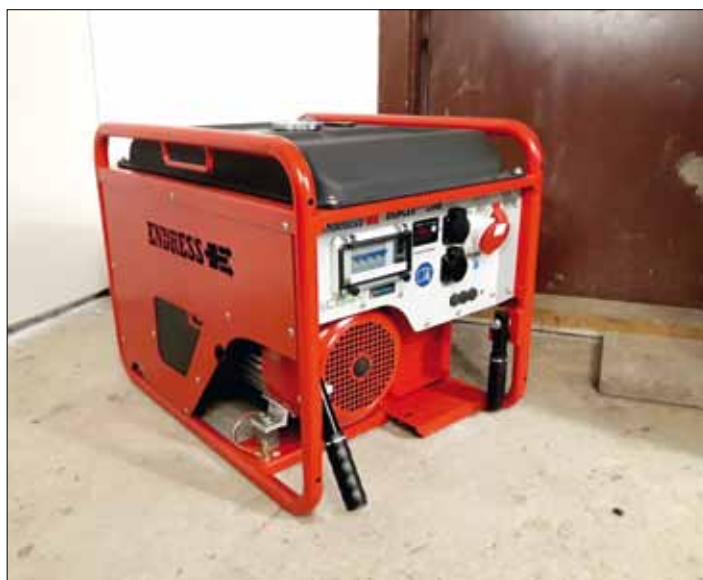
Silná elektrocentrála poslouží jako náhradní zdroj.