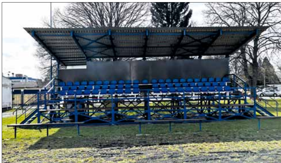
Opravená a nově vybavená tribuna čeká na diváky.

Železná konstrukce tribuny byla obroušena a opatřena novým nátěrem, kompletně vyměněny byly dřevěné prvky zadní stěny a podlahy, instalovány byly nové plastové podsedáky. Pro lepší pohodlí budou na pokladně před utká-