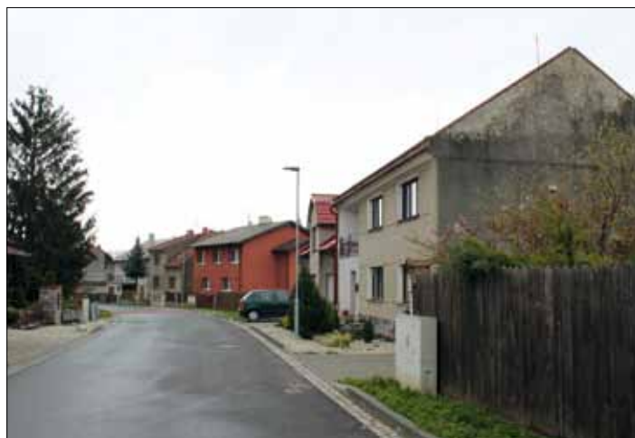
Dnešní Pohoršov po předloňské „revitalizaci“.