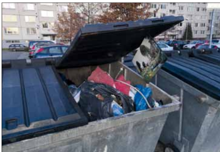
Všichni pevně věříme, že tento pohled bude brzy jen nenávratnou minulostí.

Osobně se na „polopodzemáky“ těším čím dál víc.