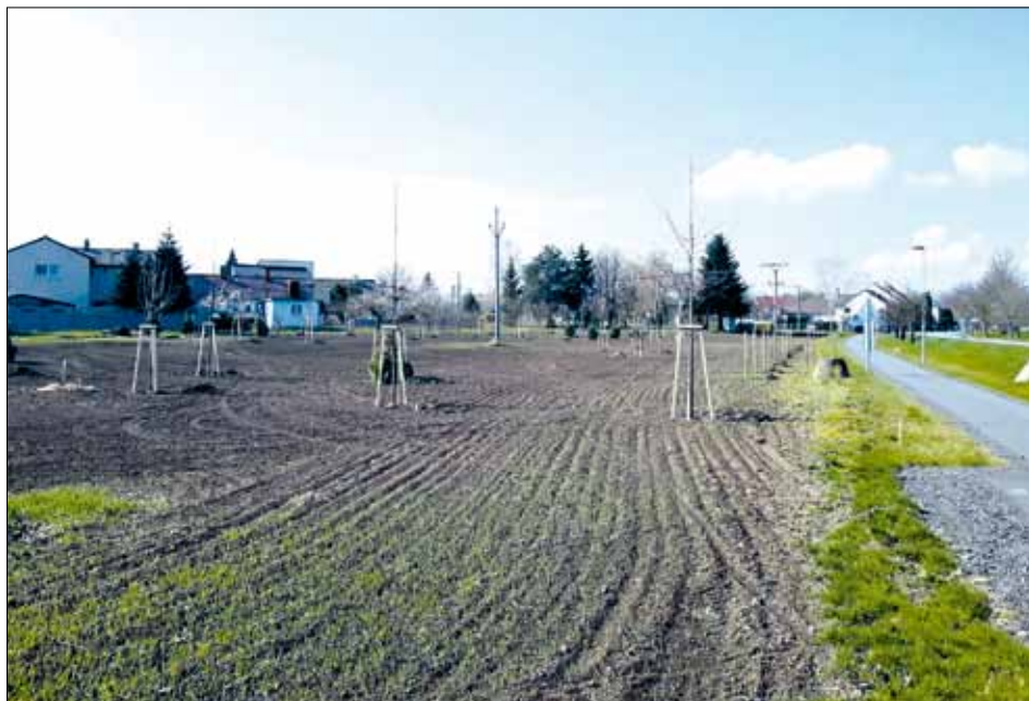
U cyklostezky v Třebčíně už rostou první stromy budoucího parku.

ličnatých stromů, 36 stromů ovocných a stovky keříků a trvalek. Stejně jako v lutínském parku je i výsadba v novém