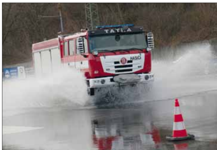
Kurz bezpečné jízdy za extrémních podmínek je velkou školou pro řidiče.

Proto v letošním roce uvítali naši strojníci, díky dotaci z Olomouckého kraje, možnost absolvovat kurz bezpečné jízdy na speciálním polygonu v Ostravě u společnosti Libros. Zde si v sobotu 13. března vyzkoušeli ovládnutí mnohatunového kolosu ve skutečně extrémních podmínkách