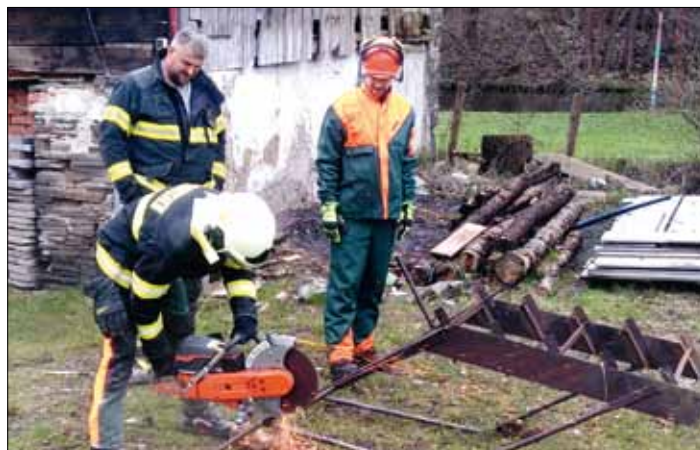
Výcvik s rozbrušovací pilou.