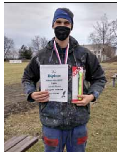
Pro radost a zdraví běželi a chodili malí i velcí.