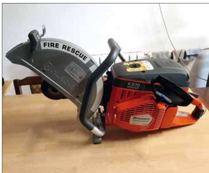
Rozbrušovací pila pro dělení materiálů při vyprošťování osob.