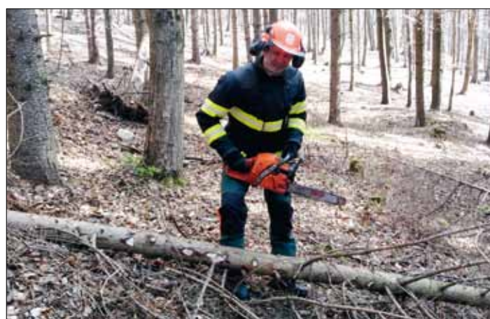
Poražený strom je třeba zbavit větví.