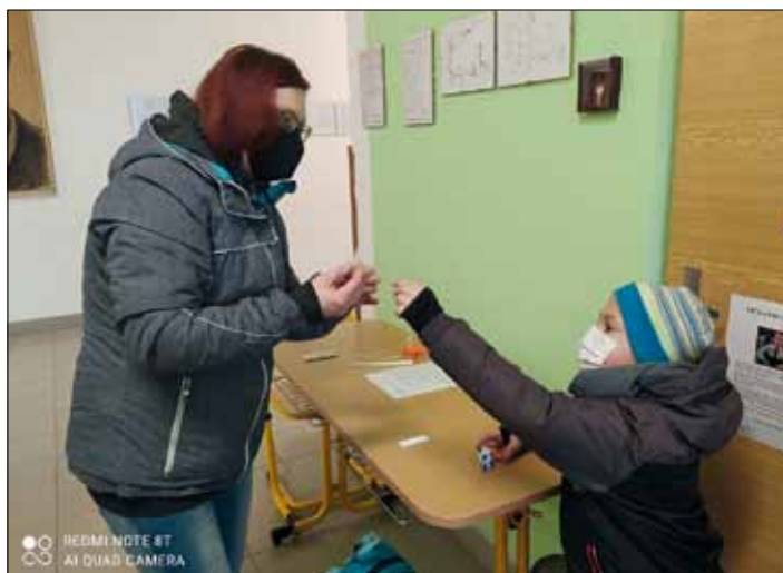
Testování je nutné, ale nebude trvat navěky.