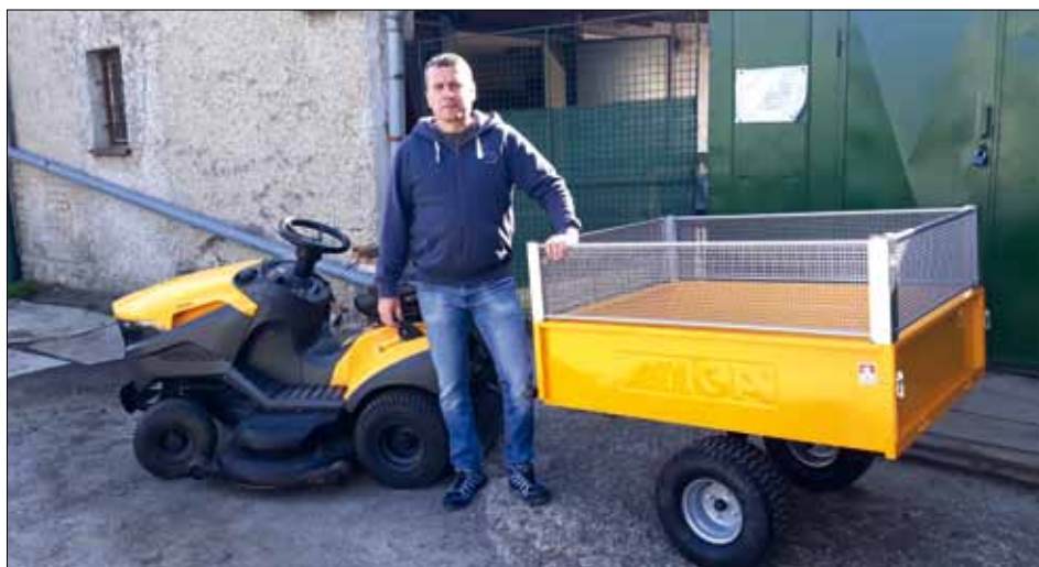
Vlečka za sekačí traktor má sloužit pro převos příslušenství sekačky a náradí.