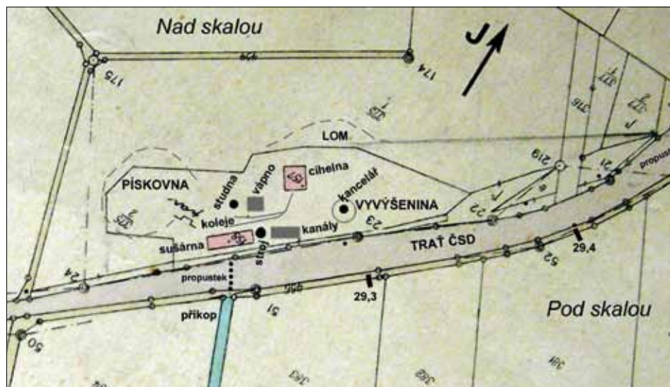
Areál lomu Ing. Skály doplněný o poznatky p. Milana Lakomého.

Areál firmy se nacházel jihozápadně od vesnice hned za železniční tratí. Na katastrální mapě z období mezi válkami jsou zde na parcele 375/2 zachyceny dvě stavbičky