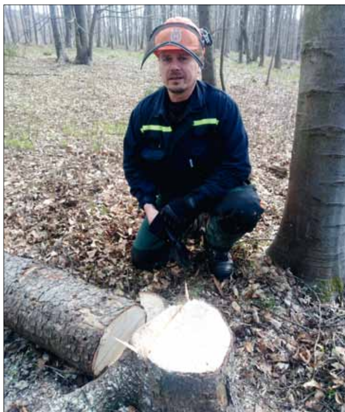
Zkouška skončila – strom padl na správné místo.