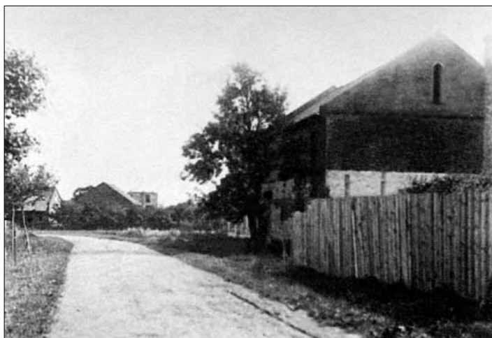
Pohoršov „shora dolů“.