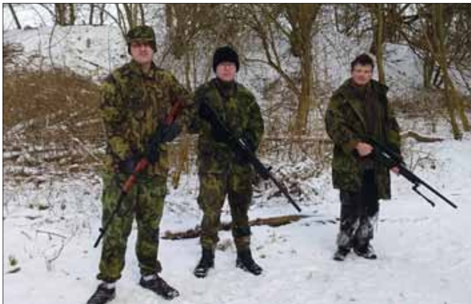
Videozáznamy pořízené žáky jsou důkazem jejich pohybové aktivity.

(tabata = neefektivnější, nejtěžší a nejnáročnější metoda intervalového tréninku, účinné hubnoucí cvičení)