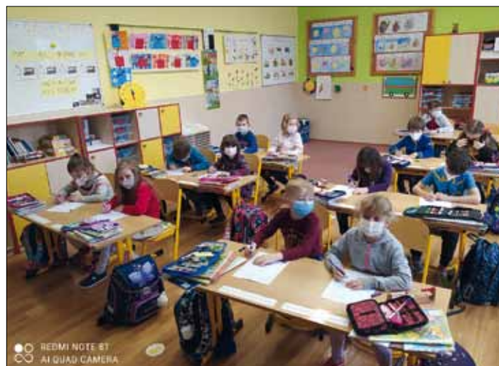
S nezbytnou rouškou, ale konečně ve třídě mezi kamarády!