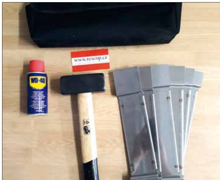
Speciální sada nářadí je určena k otevření plastových oken.