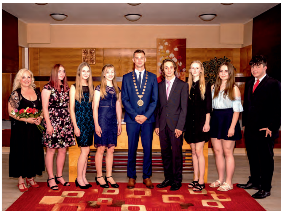
Slavnostní setkání a odměna za práci patřily těm nejlepším.

Spolu s učiteli a vedením obce blahopřejeme všem vyznamenaným k úspěšnému ukončení školní docházky a přejeme šťastný start do dalšího studia.