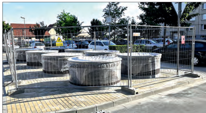
Kulturní prostředí je i na sběrných místech vizitkou nás všech.

Od poloviny června vrcholí stavební práce na nových polopodzemních kontejnerech na sídlišti. Vnější části kontejnerů jsou stavebně usazeny a okolí je předlážděno. Čeká se pouze na dovoz vnitřních částí kontejnerů s víky, které (jak již bylo deklarováno) budou osazeny elektronikou. Ta víko odemkne pouze po přiložení RFID čipu. Elektronika rovněž dokáže evidovat počty vhozů dané domácnosti. Daný systém vyžaduje, aby uživatel po vhozu odpadu víko kontejneru uzavřel, protože jinak by ochrana proti cizím „dodavatelům odpadu“ nefungovala.