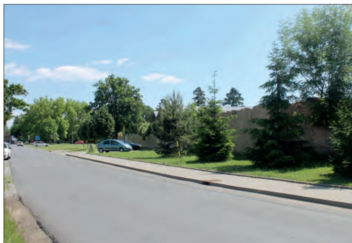
Ulice Na Záhumení dnes.