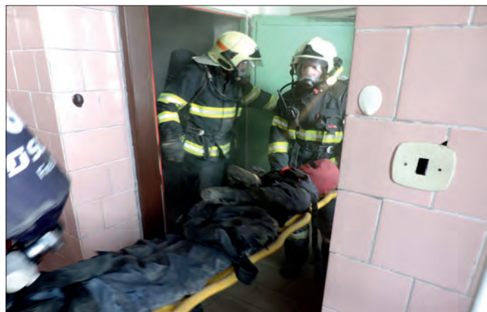
Vynášení „zachráněné“ figuríny ze zadýmeného prostředí.

S vidinou blížícího se rozvolnění protie-