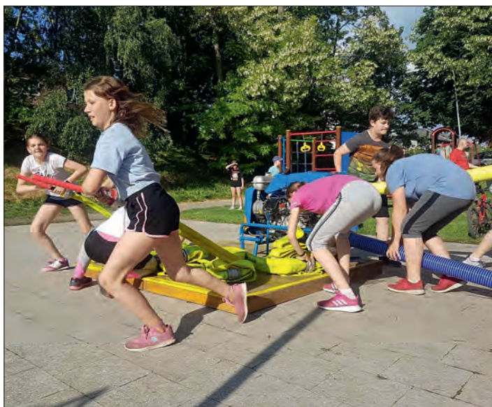
Hry a soutěže patří k oblíbené náplni schůzek.

Pandemie ustupuje, a tak odstaroval i náš kroužek mladých hasičů. Na dětech bylo vidět, že se těšily jak do kroužku samotného, tak na kamarády. Během covidové doby náš kolektiv nikdo neopustil a převážně jsme se scházeli v plném počtu. Počasí nám zatím pokaždé přálo, takže jsme mohli začít pořádně „útočit“.