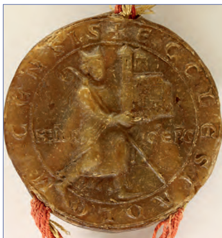
Pečeť olomoucké kapituly s vyobrazením biskupa Jindřicha Zdíka.

V době vzniku listiny došlo v tehdejší českém knížectví a na tzv. moravských údělech (olomoucký, brněnský a znojenský) ke změnám. Předně knížete Soběslava I. (1125-1140) vystřídal na českém stolci kníže Vladislav II. (1140-1172). Ten je ale znám spíše jako druhý český král Vladislav I., kterým se stal v roce 1158. V Olomouci se zase