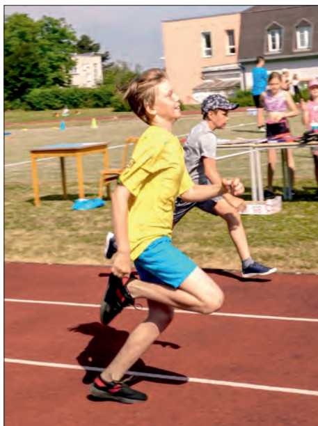
Závodníci neskrývali radost z pohybu a snahu být co nejlepší.