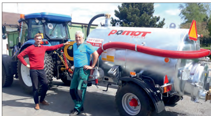
Nová cisterna usnadní pracovníkům TS údržbu veřejné zeleně.