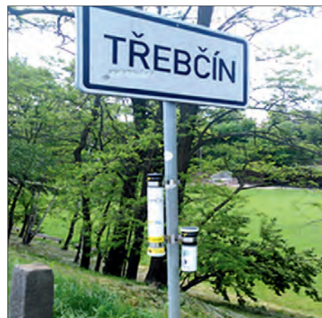
Reflexní nálepky nejsou na hraní!