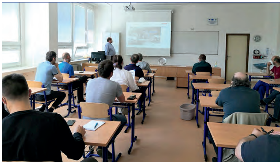
Seminář přinesl řadu cenných informací.

Hlavní téma semináře, který se uskutečnil v prostorách Sigmundovy střední školy strojírenské, bylo zaměřeno na 3D digitální technologie a 3D měřicí systémy, to znamená racionální řešení daného problému pomocí 3D tisku i skenování a také dokonalé proměření obráběných součástí včetně volby optimálních režných podmínek v rámci CAD/CAM systému.