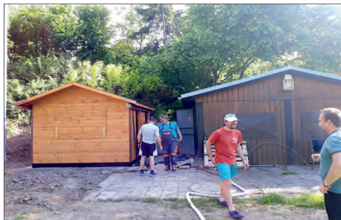
Budování základové desky pro nový domek v Ohradě.