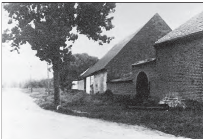
Záhumení v roce 1940.