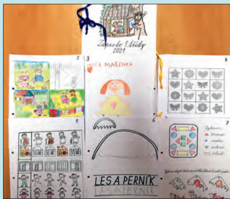
„Přijímací zkouška“ budoucích prvňáčků.

Také v tomto školním roce proběhl zápis dětí do prvního ročníku ZŠ elektronicky, a to v termínu od 1.4. do 30.4.2021. Celkem se k zápisu „dostavilo“ 36 dětí. 27 dětí bylo přijato, devíti byl udělen odklad povinné školní docházky. Od 1.zářní 2021 budou děti pracovat v jedné třídě - v I.A.