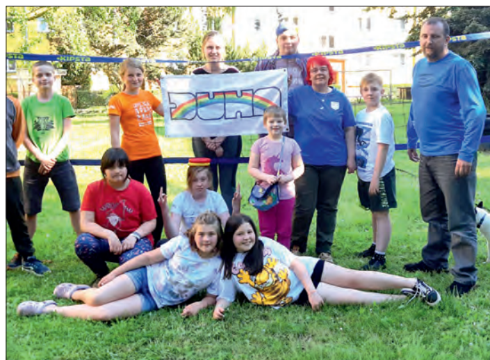
Na tuhle chvíli jsme se všichni těšili!