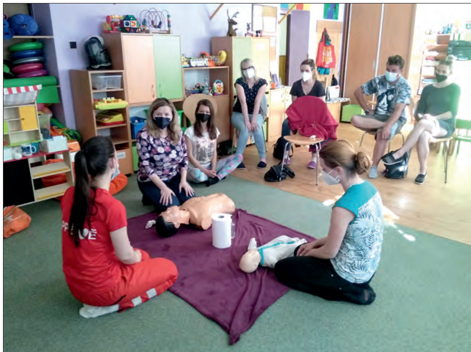
Praktická ukázka první pomoci při poranění dítěte.