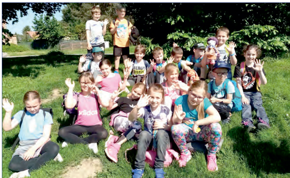
Chvilka odpočinku „za humny“ Slatinic.