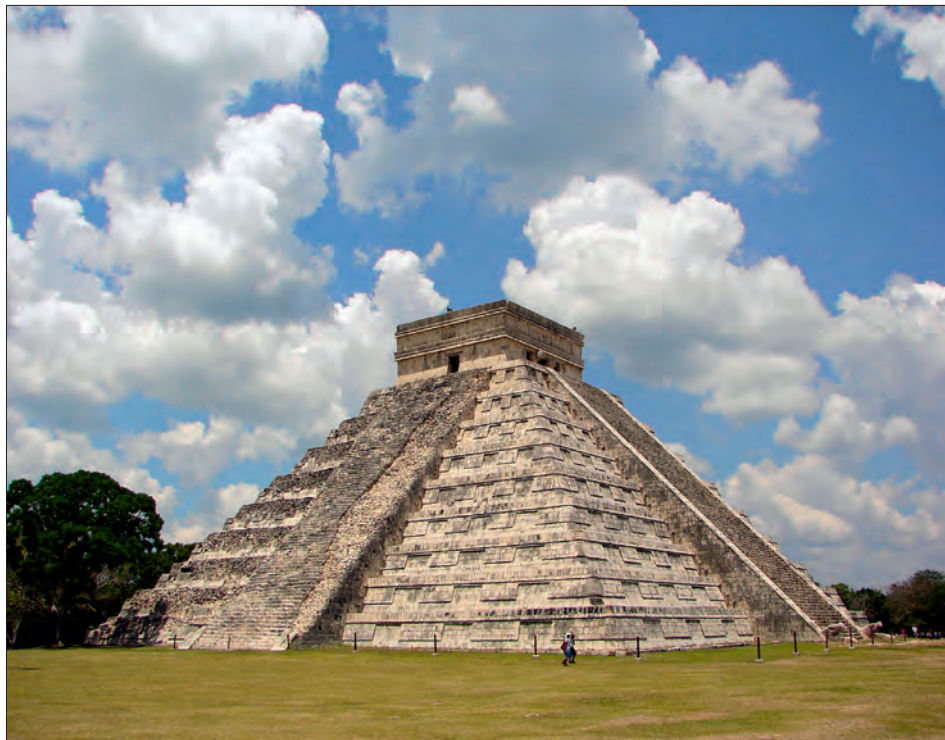
Pyramida v Chichen Itzá, památka po civilizaci starých Mayů na území dnešního Mexika.