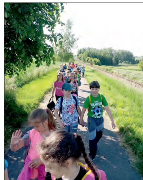
„Mega“ výlet po nové cyklostezce.