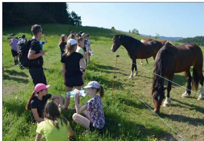
bylo plné překvapení, setkání, her a sportu.