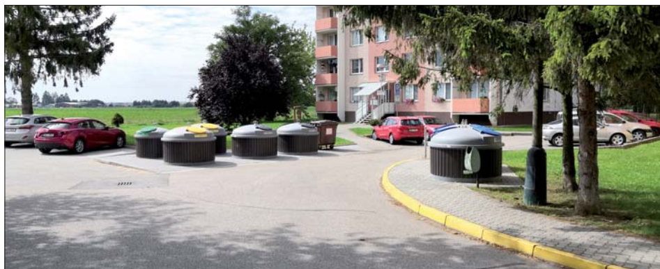
Kontejnery u domu č.p. 208.