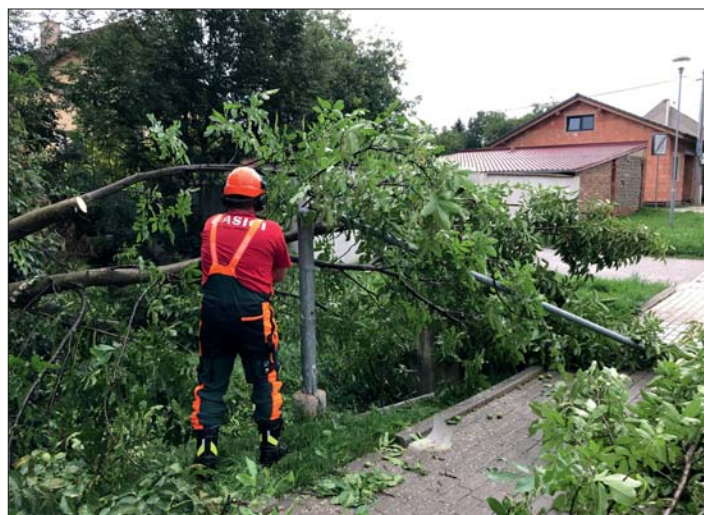
V srpnu uklízeli hasiči u nádraží ořešák zlomený větrem.