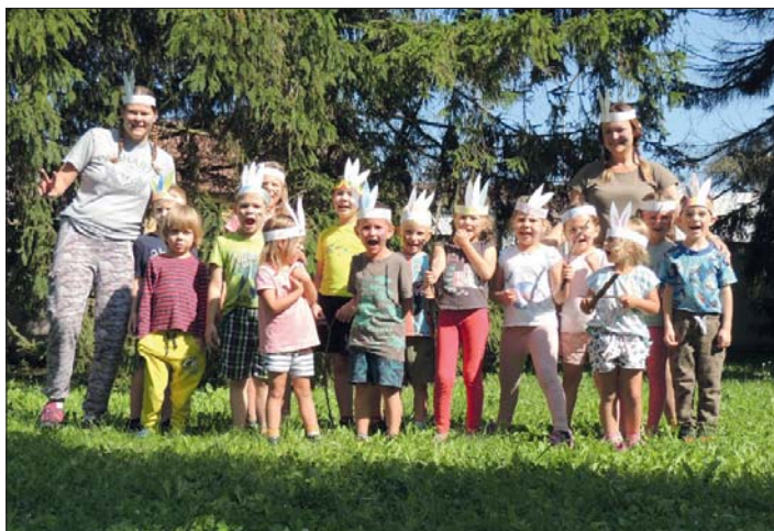
Po „cestě kolem světa“ ...