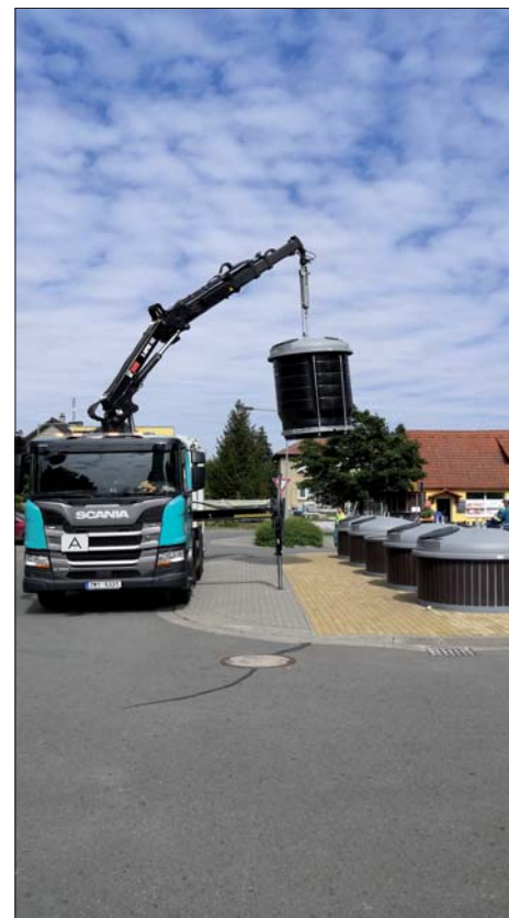
Vyvázení polopodzemních kontejnerů.