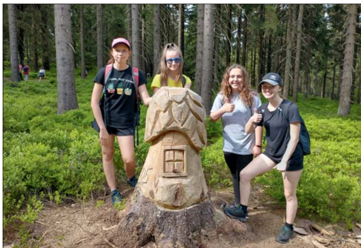
Putování krásnou krajinou Jeseníků

(Bohatou fotogalerií se účastníci výletu určitě pochlubili na školních panelech.)