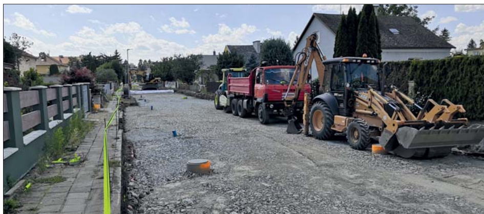
Práce na Růžové ulici pokračují.

CETIN (z důvodu nových parkovacích zálivů) a probíhá sanace podloží pod vozovkou a budoucími parkovacími zálivy.