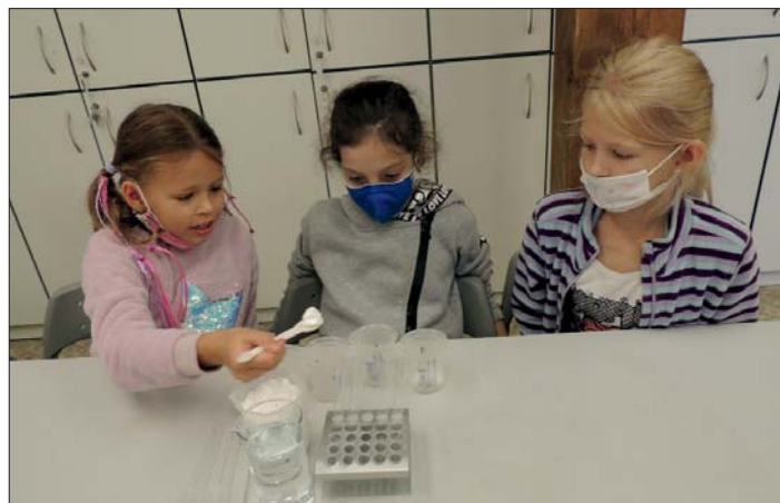
„Čarování“ v Pevnosti poznání.