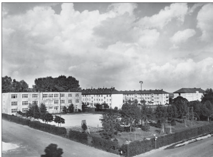
50. léta: zleva bývalá škola OU, bytové domy v Břízové a Růžové ulici, vpravo vzadu dům č.p. 192 (tehdy ubytovna „u Čepů“).