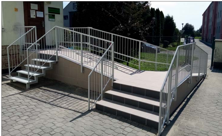
Takhle teď vypadá nový vchod do knihovny.