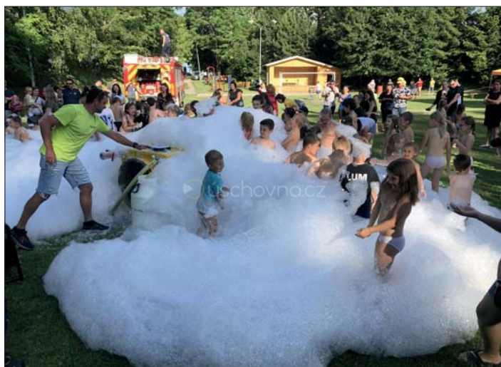
Pěnová koupel – „zlatý hřeb“ rodinného odpoledne.

Členové Sboru dobrovolných hasičů dokončili v rámci svých brigád instalaci nového dřevěného domku v Ohradě a na začátek prázdnin připravili pro děti