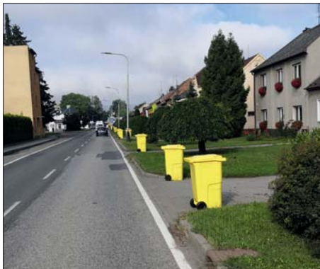
V Olomoucké ulici.

Jsem velmi mile překvapen, že bylo rozdáno téměř 400 sad nádob. To znamená, že nádobami je vybaveno 80 procent všech domácností (rodinné domy