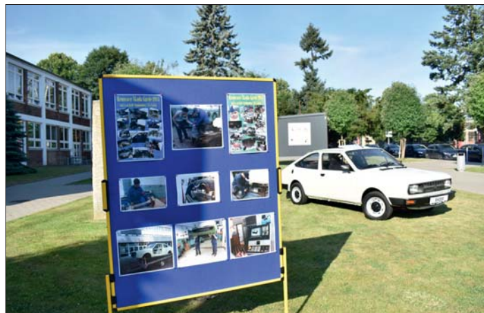
... a škodovka září v plné kráse.