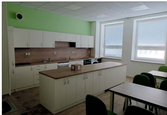
nechybí ani jídelní část.