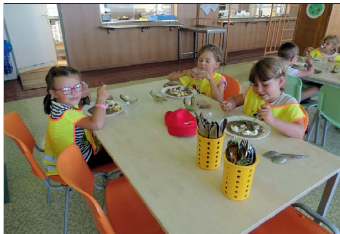
... dobrý oběd ve školní jídelně.