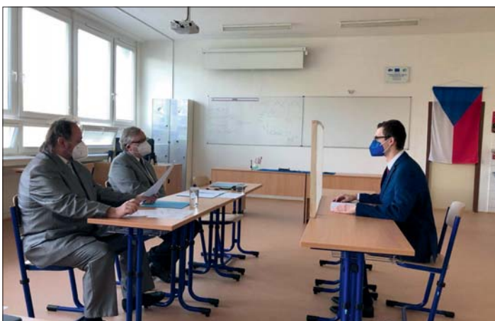
Covid necovid – zkoušky nás neminuly.