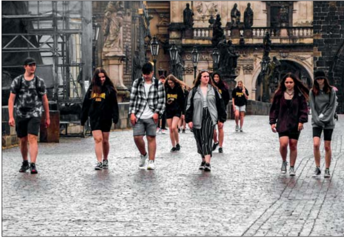
Cesta za krásami Prahy.