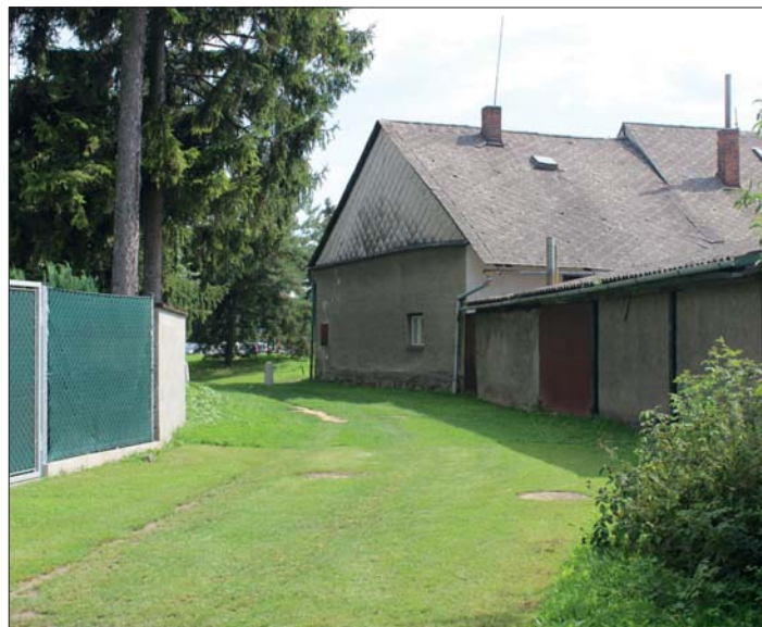
Dnes je místo potoka ulička za domy na Záhumení.