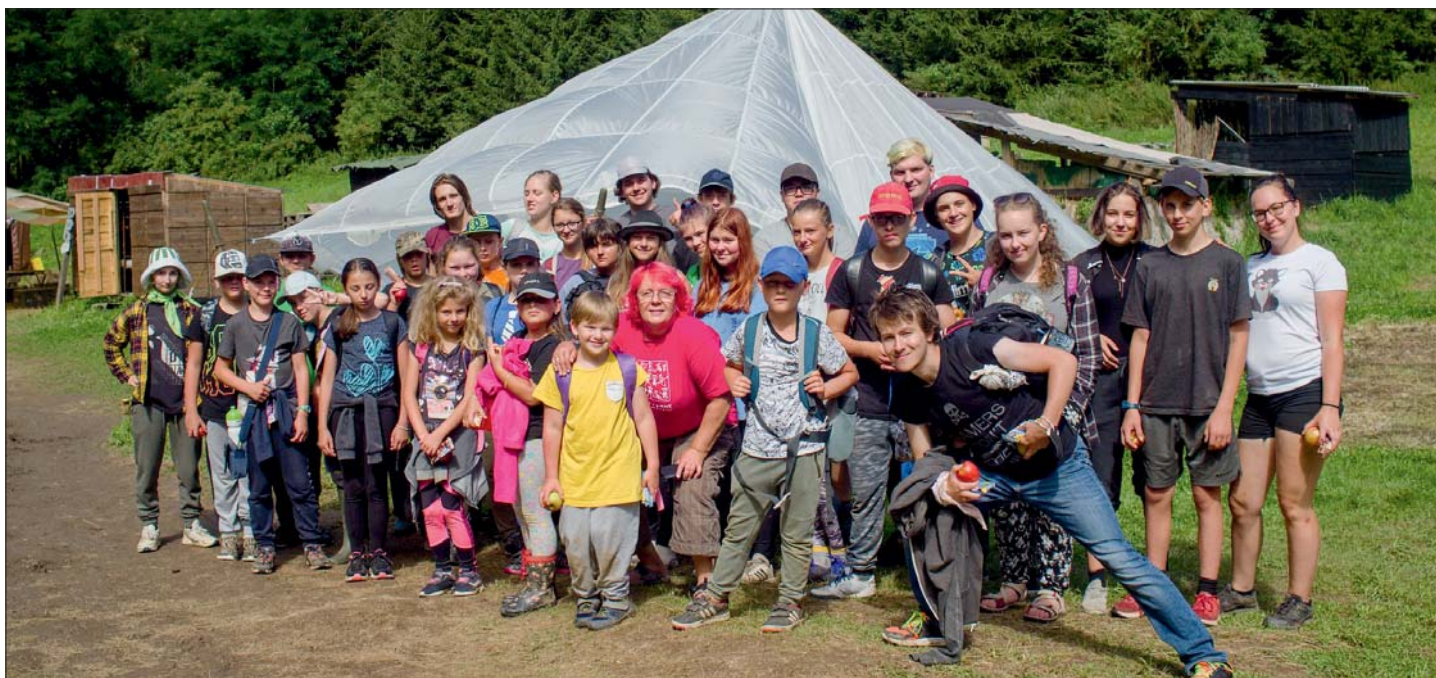
Náladu nám nezkažily ani rozmary počasí.

Podobné věci ale děláme celoročně a budeme rádi, když se k nám lutínské děti školního věku přidají opět od 1. září, každou středu od 16:15 do 18:00 v klubovně Duhy Křišťál Lutín. Budou se tam nejen bavit hrami, ale také se můžou něco naučit pro život. Tomáš „Ťuja“ Pospíšil (jr.)