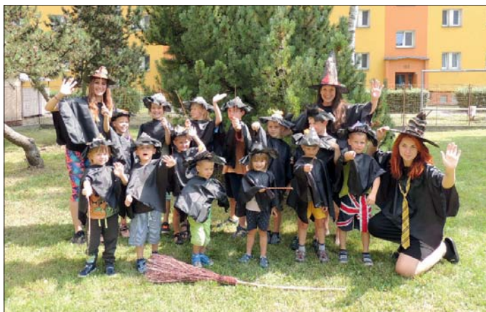
Malí kouzelníci v čarodějnických hábitech.

O hladová „bříška“ se v prvním a druhém turnusu starala slatinická restaurace „U Minářů“, která dodávala dětem jídlo přímo do Klásku, od 9. srpna se třetí turnus stravoval ve školní jídelně ZŠ.