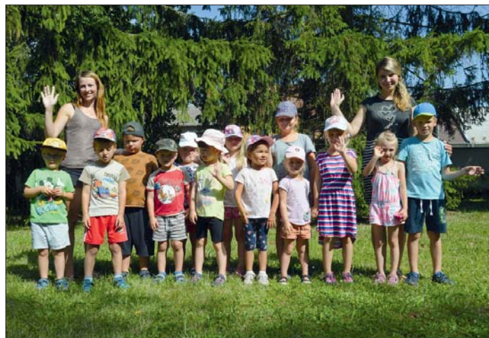
Všichni společně v zahradě Klásku.