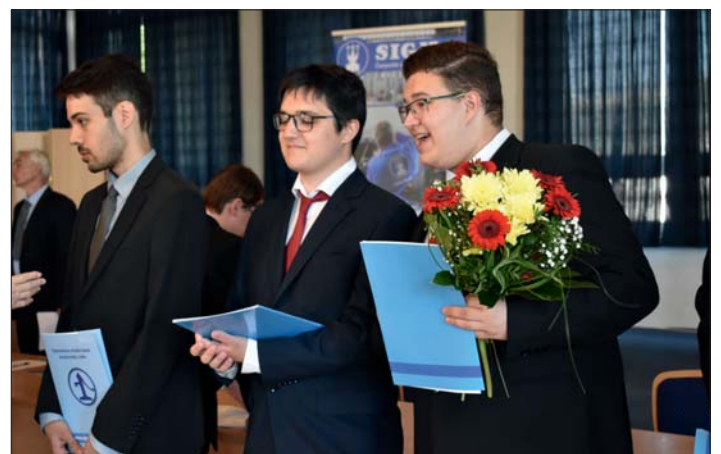
A to nejlepší na závěr.