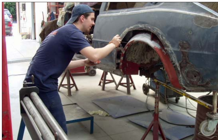
Místo „lámání hole“ generální oprava ...