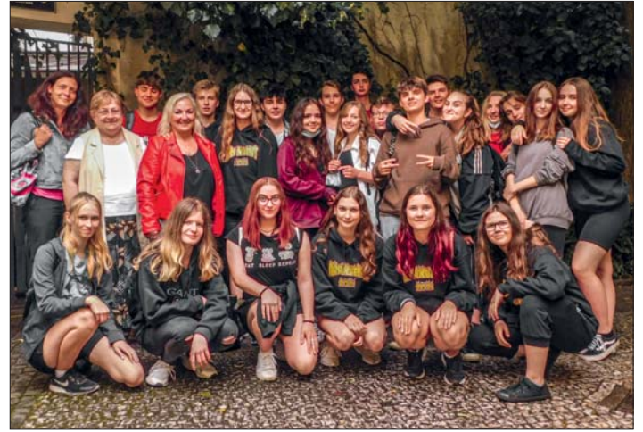
Společné foto pro chvíle vzpomínání.