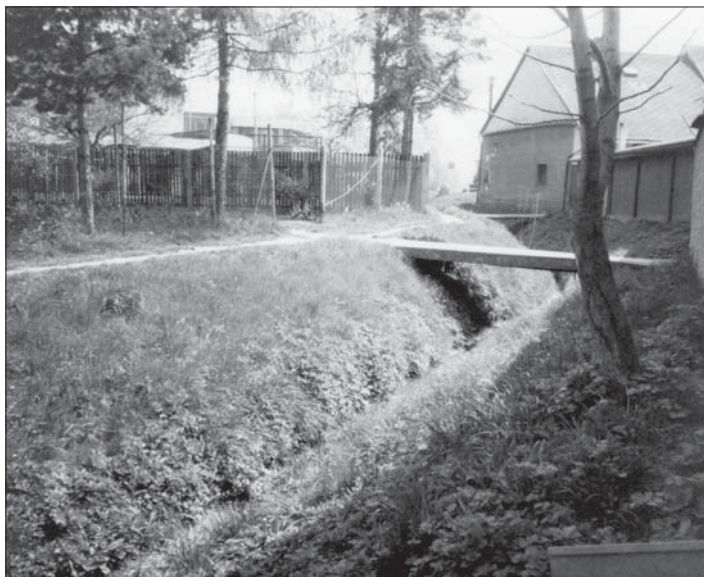
Potok Slatinka před vyústěním u pošty do konce 20. století.