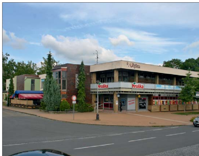
Stejné místo s restaurací a nákupním střediskem dnes.