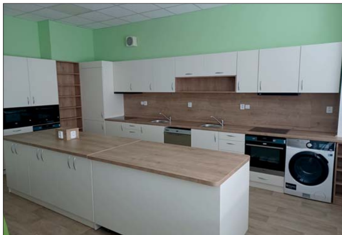
Cvičná kuchyňka je plně vybavená,