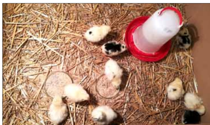
Odměnou byla radost z krásných kuřátek.