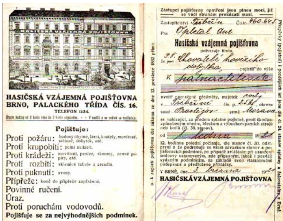
Dokumenty z Pamětní knihy Třebčína.