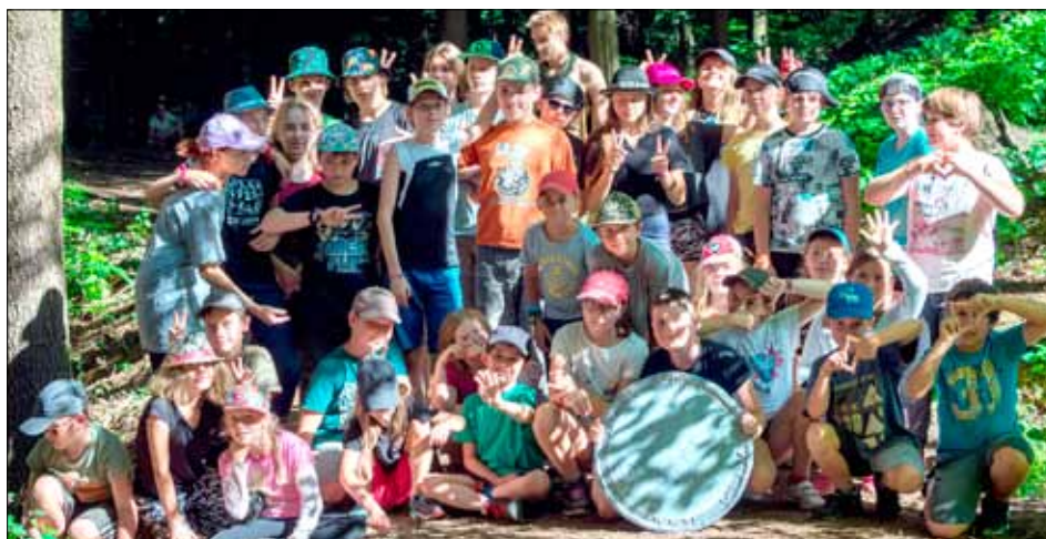
Zachraňovali jsme svět ve dne i v noci.