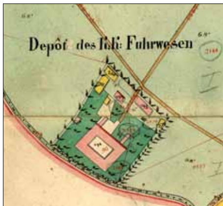
Výřez z indikační skici Hněvotína z roku 1833.

Hněvotína v roce 1862, a ta již ukazuje v podstatě stav, který pak vydržel dlouhá léta a řada z nás si jej ještě pamatuje.