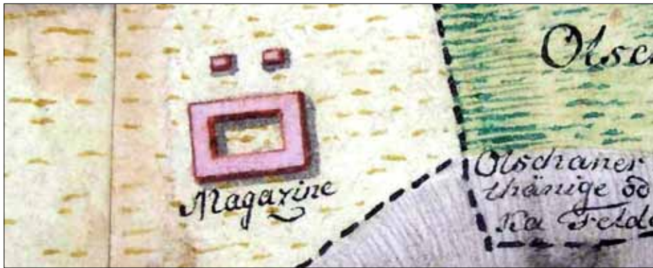
Výřez z indikační skici Hněvotína z roku 1833.

v souvislosti s úpravou pozemků obcí, které vedly spory o pastviny Blata. Je zde vidět čtvercový půdorys a dvě drobné stavby před „magacínou“. Orientace obrázku je přibližně severovýchodně na horní straně.