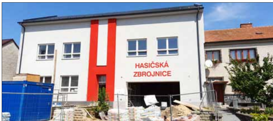
Stavba zdárně pokračuje.

Uvnitř budovy už jsou z velké části hotové omítky. Dvůr je připraven na výkopové práce pro osazení kanalizace a dešťové retenční jímky. Máme navrženou podobu