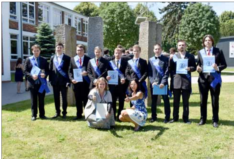
Máme to za sebou – vzhůru do světa!