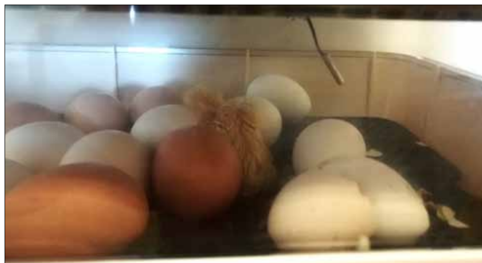
Čekání na „zázrak“ trvalo měsíc.

Z celkového počtu patnácti vajec v líhni