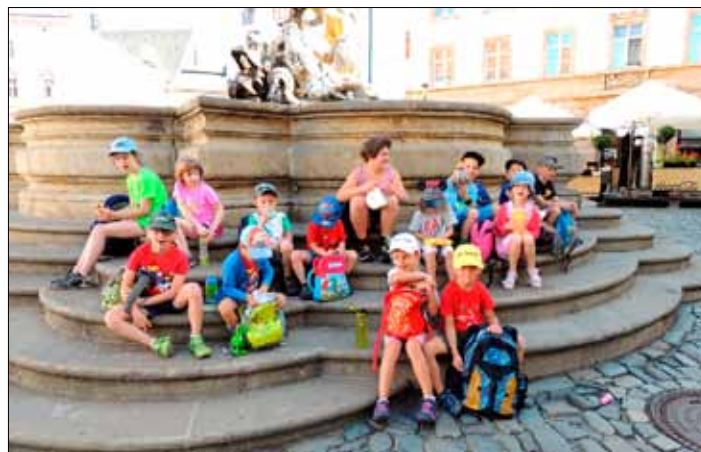
Na výletě v Olomouci.