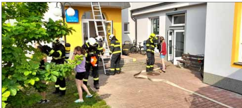
Cvičný zásah v lutínské škole.