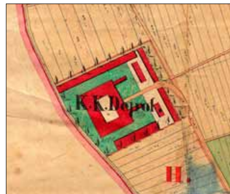
Výřez mapy zachycující úpravu pozemků na západě hněvotínských hranic z roku 1862.