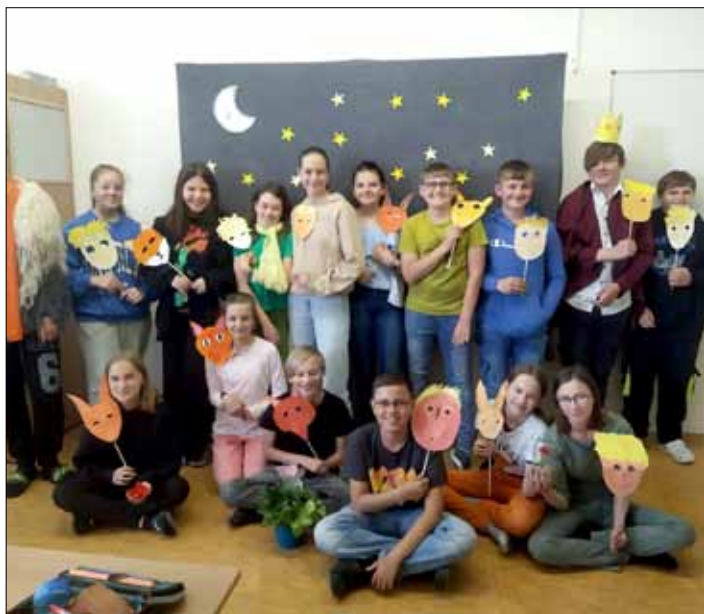
Kostýmy, výběr hudby a samotné dialogy byly dílem celé třídy.