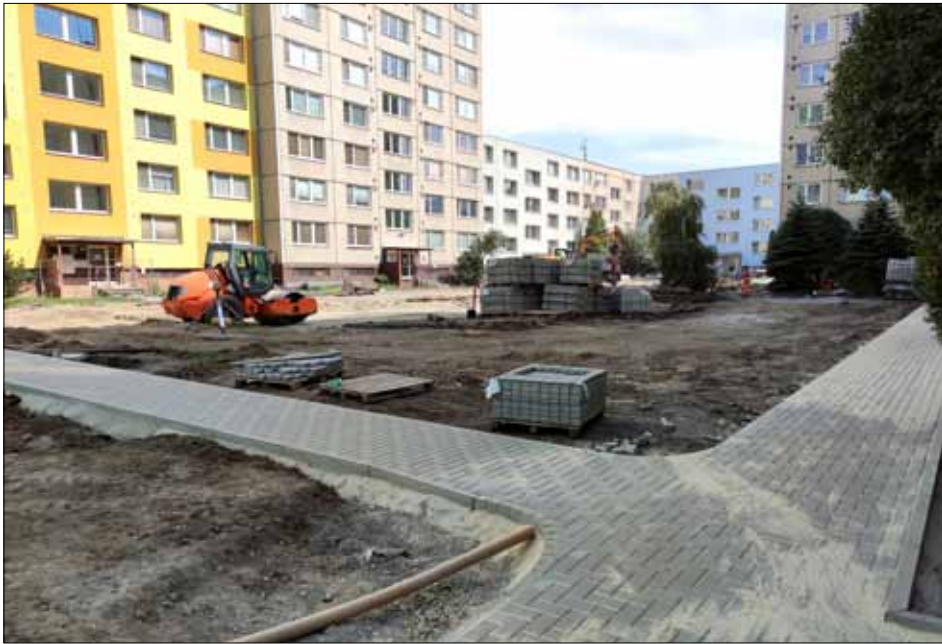
Dvůr na sídlišti dostane zcela novou podobu.