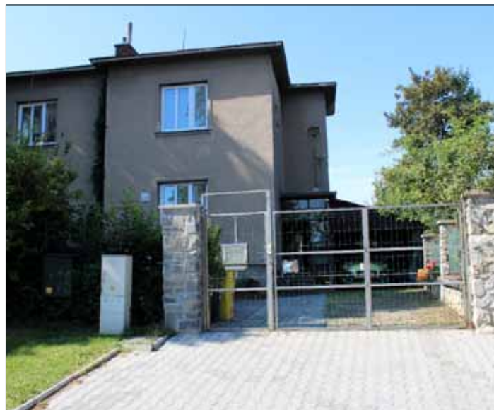
Vilka č.p. 133 v ulici Za Rybníčkem.