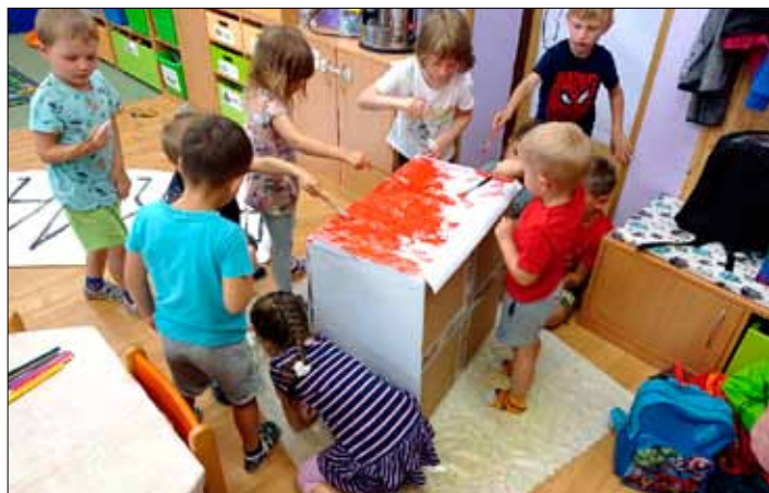
Herna se změnila v malířský ateliér.