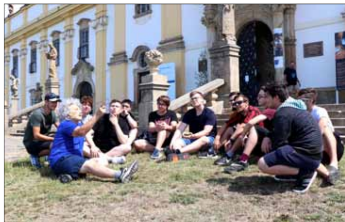
Loučení s „Albertem“ (první vlevo).