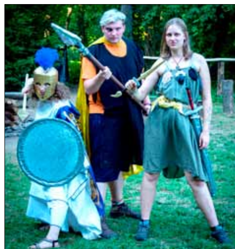
Bojovníci v plné zbroji.