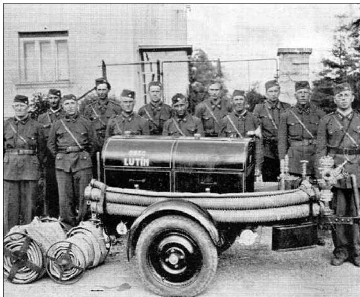
Lutínský hasičský sbor v roce 1949.