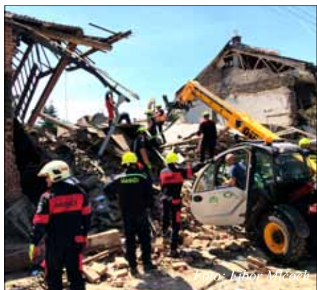
Pomoc po výbuchu plynu v Olšanech.

Pro děti účastníků i hostů sobotního gulášového klání připravuje kulturní komise druhý ročník koloběžkářdy, která proběhne také v Ohradě v Třebčině. Bude připraven oblíbený skákací hrad a malování na obličej, stejně jako bohaté občerstvení.