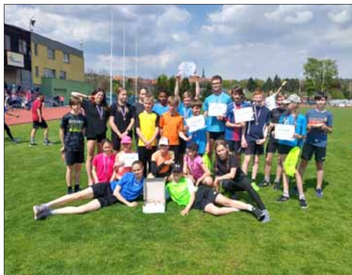
Radost z výsledku po soutěži.