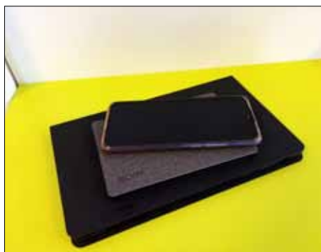
Tablet, čtečka nebo mobil? E-knihy zvládnou všechny.