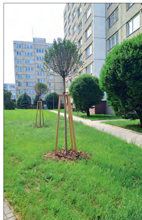
Rekonstruovaný dvůr na sídlišti v Lutíně dostane nové mladé stromy a záhony s keři a trvalkami.