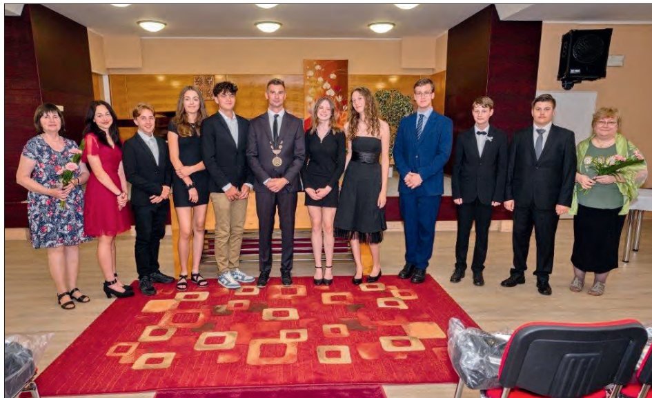
Nejlepší žáci 9. A a 9. B u starosty obce.