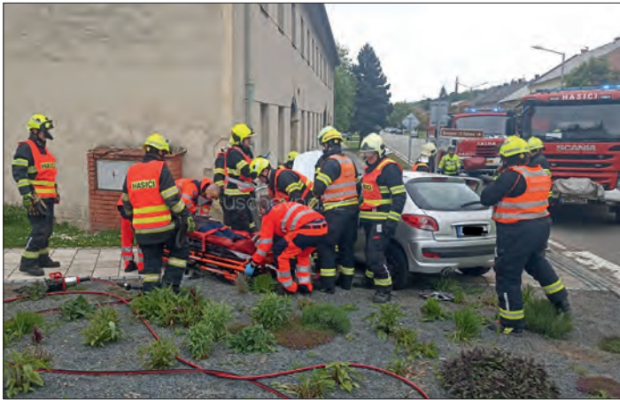
Záchranné práce u dopravní nehody ve Slatiničích.