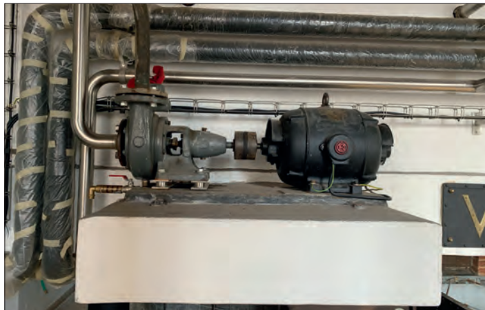
Čerpadlo NZ5A a NZ3A v kosteleckém Národním muzeu pivovarnictví.

Podle štítků šlo o typ NZ3A (průměr potrubí 50 mm) a NZ5A (dva kusy, průměr potrubí 100 mm), což byly centrifugální pumpy pro znečištěné kaly. Čerpání za-