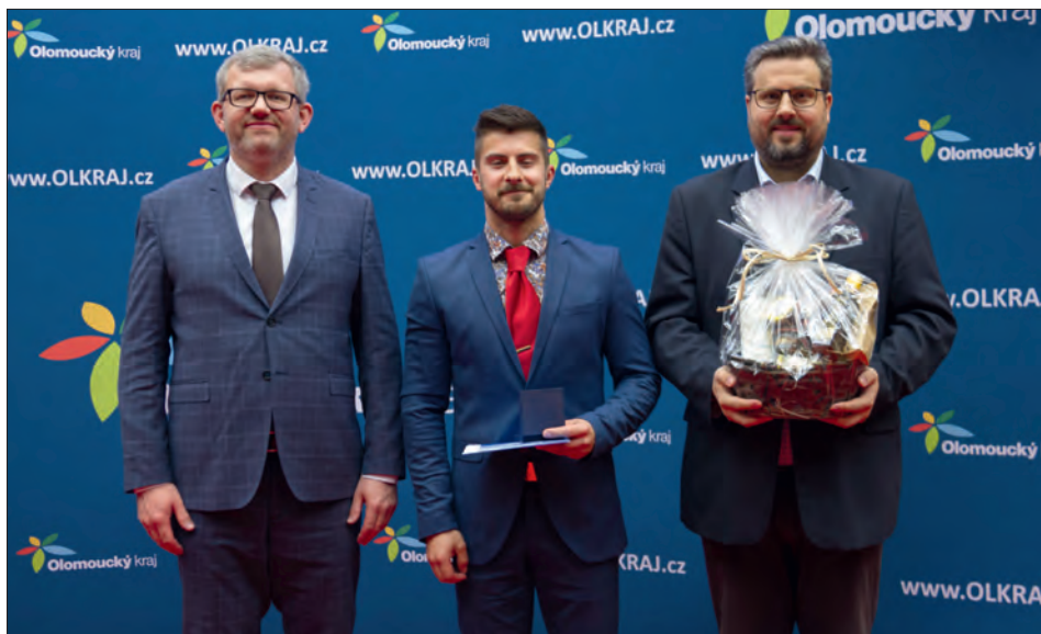
Slavnostní chvíle pro „Učitel roku“ z Lutína (uprostřed).