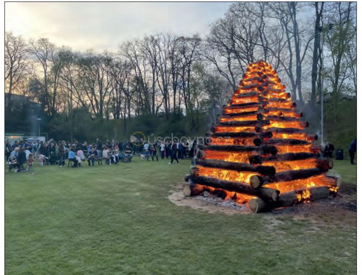
... a velkou vatrou a ohňostrojem v Ohradě.