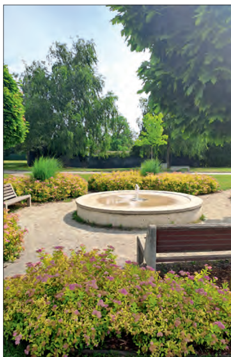
V parčíku před OÚ ve Školní ulici se můžeme osvěžit u fontánky.