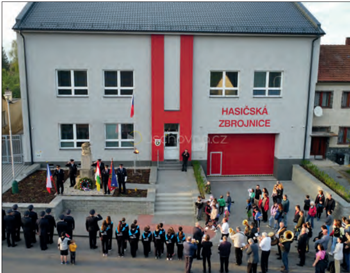
Výročí osvobození si v Třebčíně připomněli 5. května u pomníku padlým ....