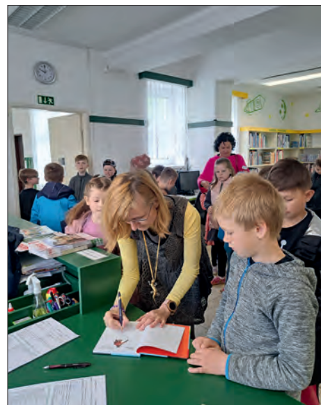
Na závěr proběhla i autogramiáda.