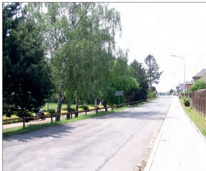
Pohled z Třebčínské ulice na dnešní Rybníček.