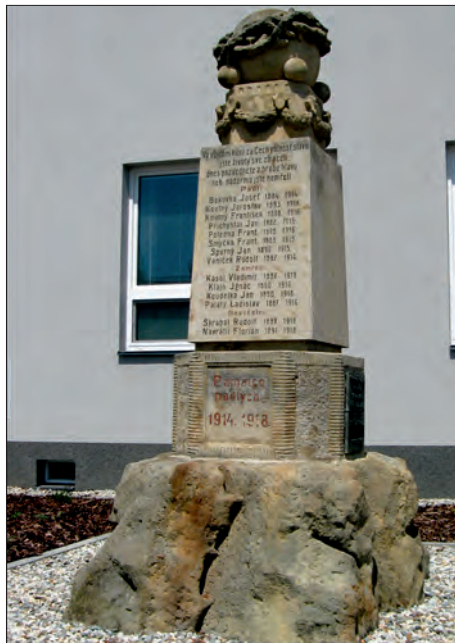
Pomník padlým u hasičské zbrojnice.

Pokud si prohlédneme zmíněný pomník u dnešní hasičské zbrojnice, zjistí-