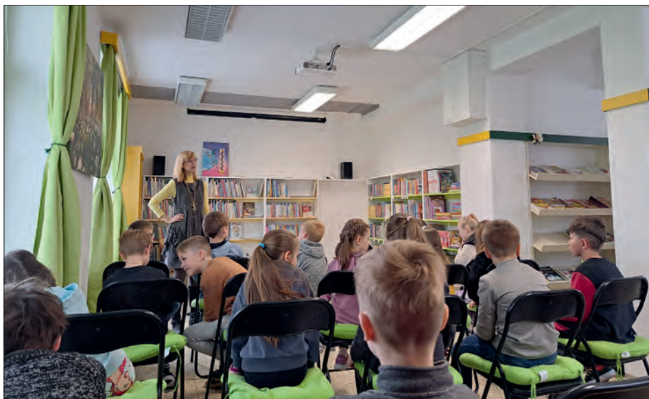
Místa a času na dotazy bylo dost.