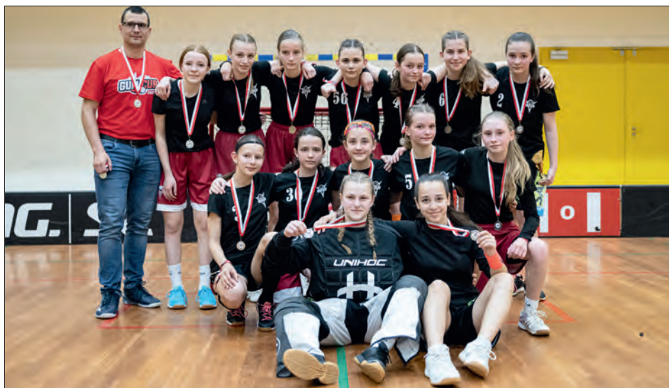
„Stříbrné“ družstvo z brněnského turnaje.

Zápasy byly hodně vyrovnané a napínavé, ale děvčata se probojovala až do finále. V náročném boji nakonec podlehla týmu Florbal Židenice a přivezla si stříbrné medaile.