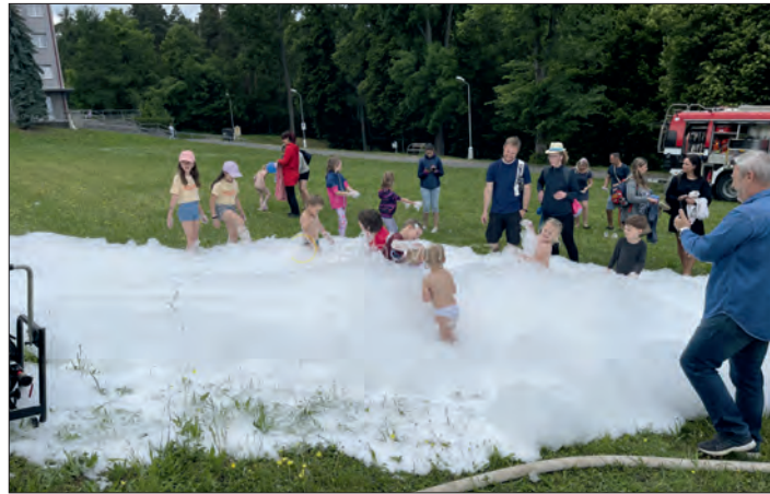
Oblíbená pěna - „zlatý hřeb“ dětského dovádění ve Slatiničích.

v Lutíně, údržbě techniky a kondičním jízdám. Pro potěšení našich dětí vyrábějí pěnu na různých akcích na Rybníčku nebo ve školce. K těmto činnostem je třeba přidat také školení ve firmách -