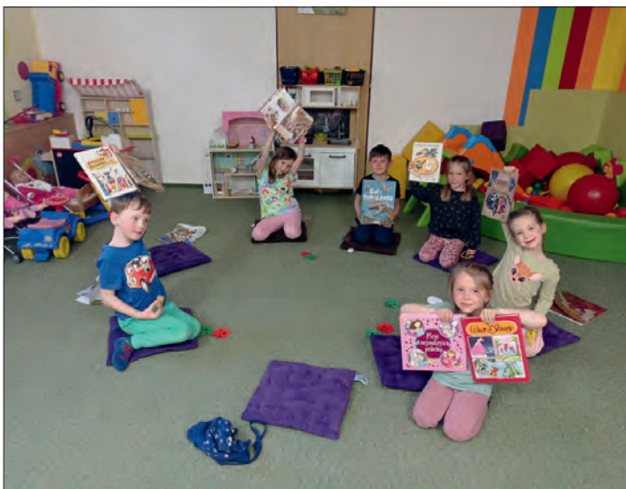
Lásce ke knize se učíme od raného věku.