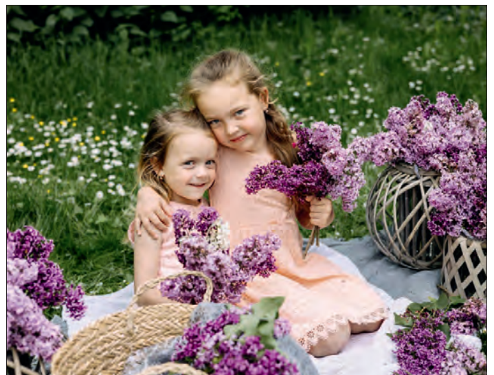
„Šeříkové princezny“ byly jako z pohádky.