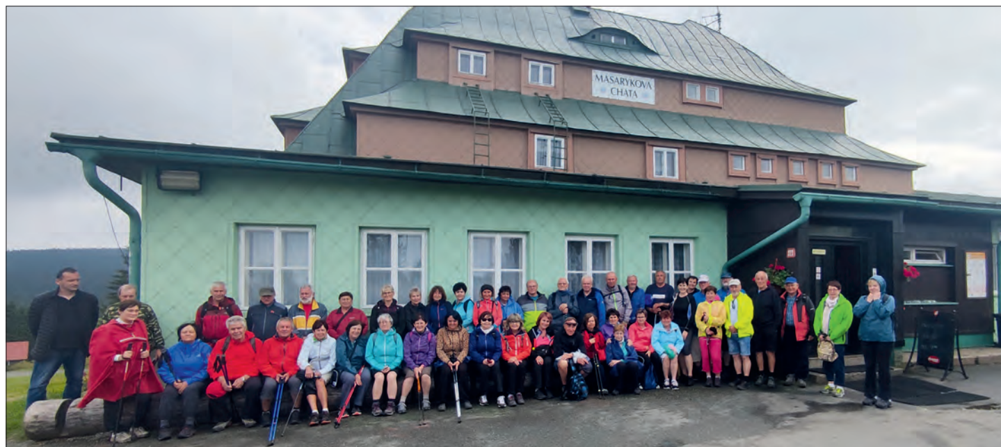
Zájezd se vydařil k velké spokojenosti jeho účastníků.