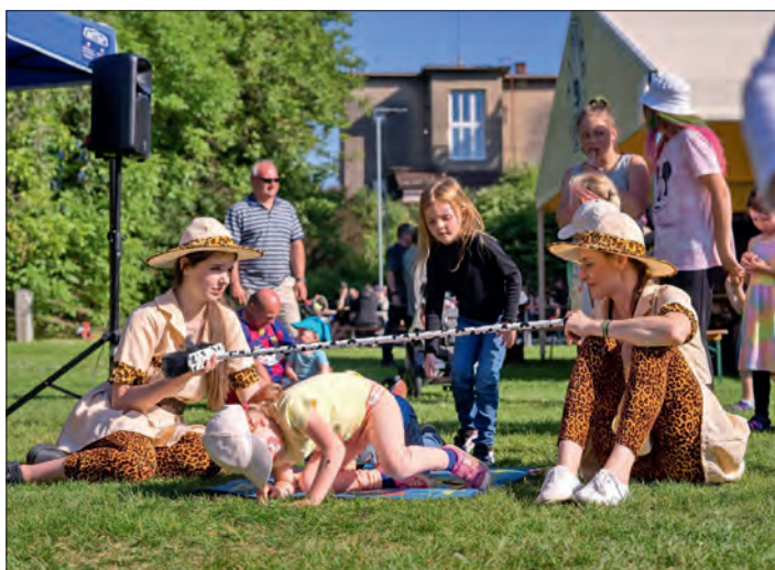
Dětský den zpestřily soutěže.