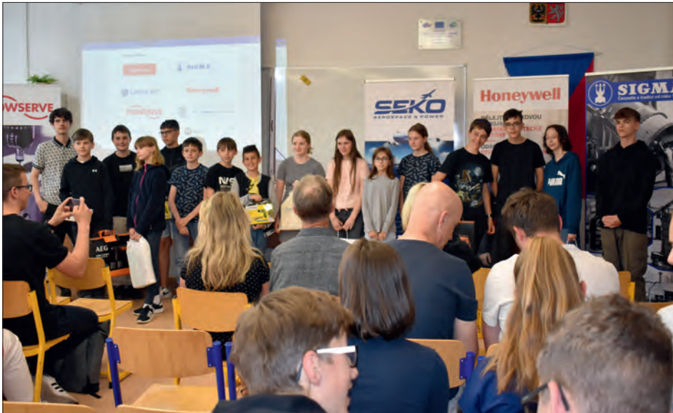
Finalisté Kreativní soutěže pro žáky 2. stupně základních škol.