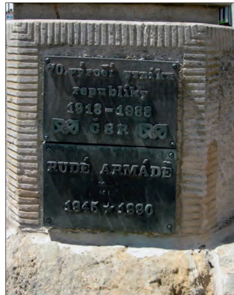
Pamětní tabulky na pomníku.

Údaje na pomníku nemohly předvídat dvě pozdější události: Po deseti letech od války, v roce 1929, došla nočnímu hlídači Tomáši Navrátilovi zpráva od nezvěst-