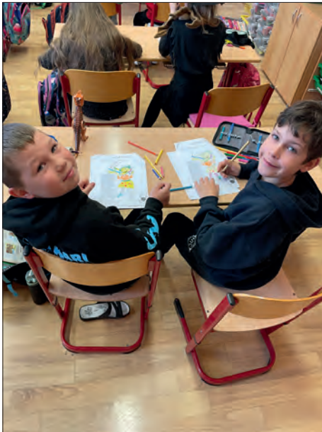
Tandemová výuka ve 3.B byla nová, zajímavá a úspěšná.