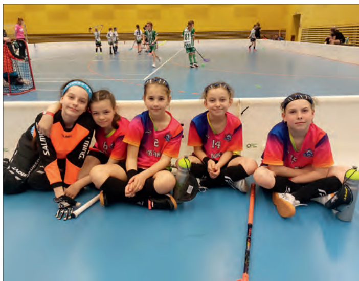
Radost z mimořádných úspěchů sdílí hráčky, trenéři, rodiče i fanoušci.

Velké díky patří rodičům za jejich podporu a fandění. Ale největší potlesk patří holkám. Za velmi krátkou dobu si dokázaly osvojit florbalovou techniku, zlepšily fyzičku a hlavně prokázaly obrovskou bojovnost a cit pro týmovou hru.