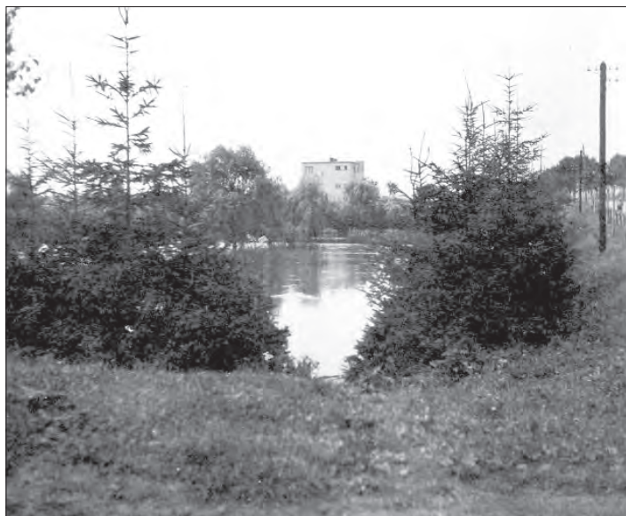
„Tolik vody v Lutíně“ bylo v roce 1939.