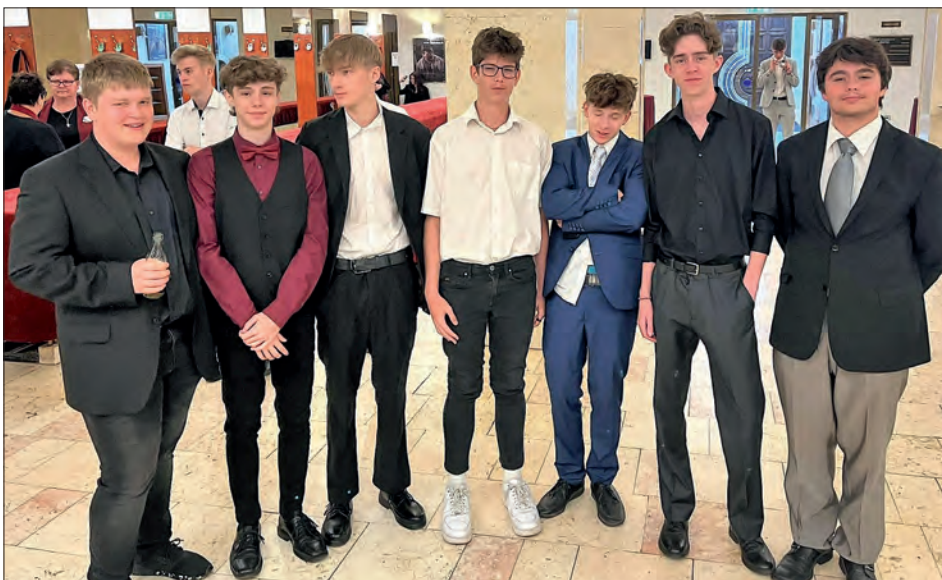
Chvilka na občerstvení, sdělení zážitků ...