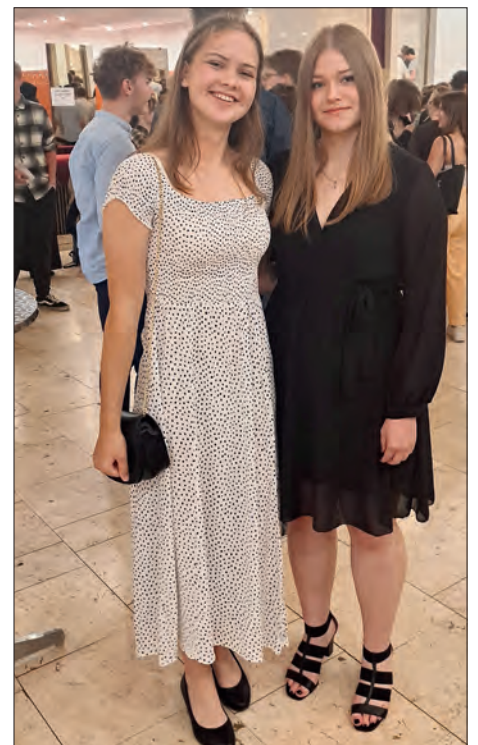
... a hezké foto.