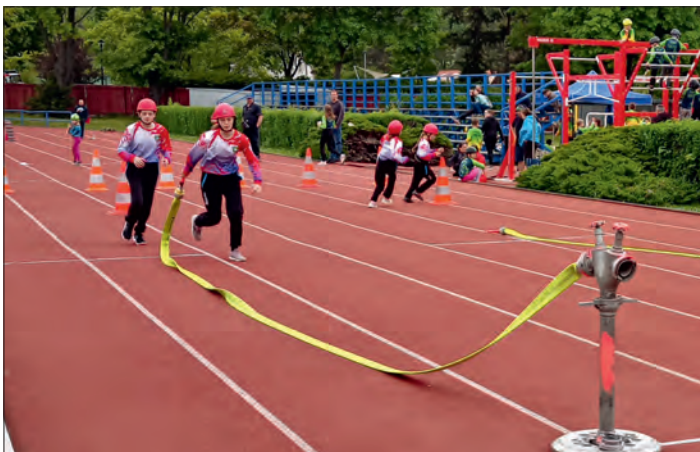
V zápalu boje.