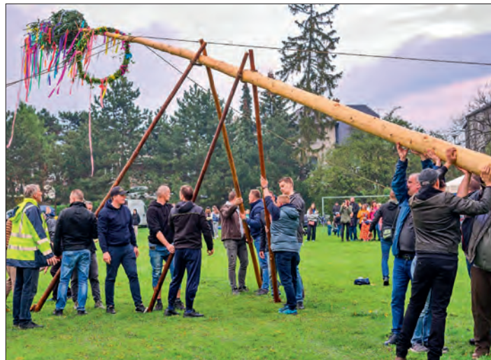
Stavění máje bylo v rukou silných chlapců.