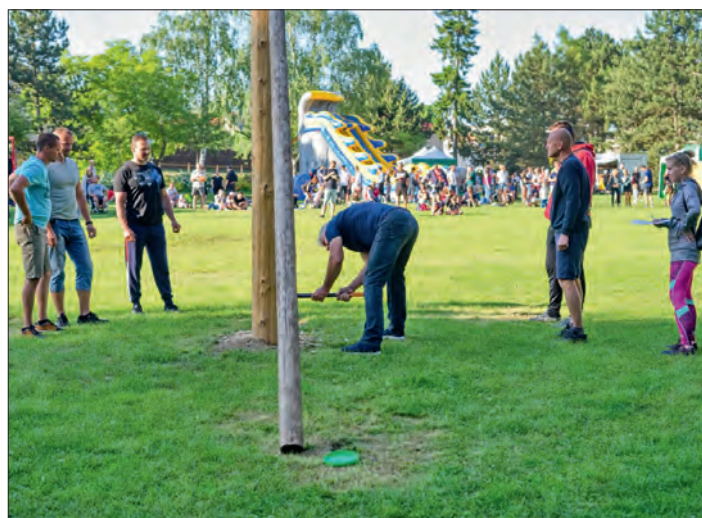
A nakonec padla – pro tento rok – i májka.