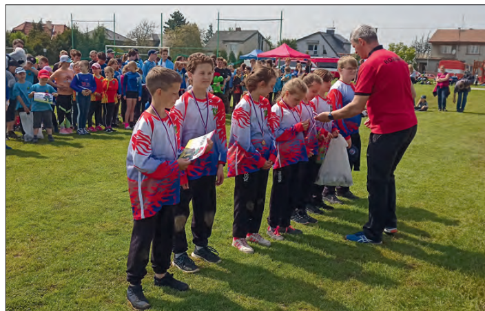
Radost z úspěchu.